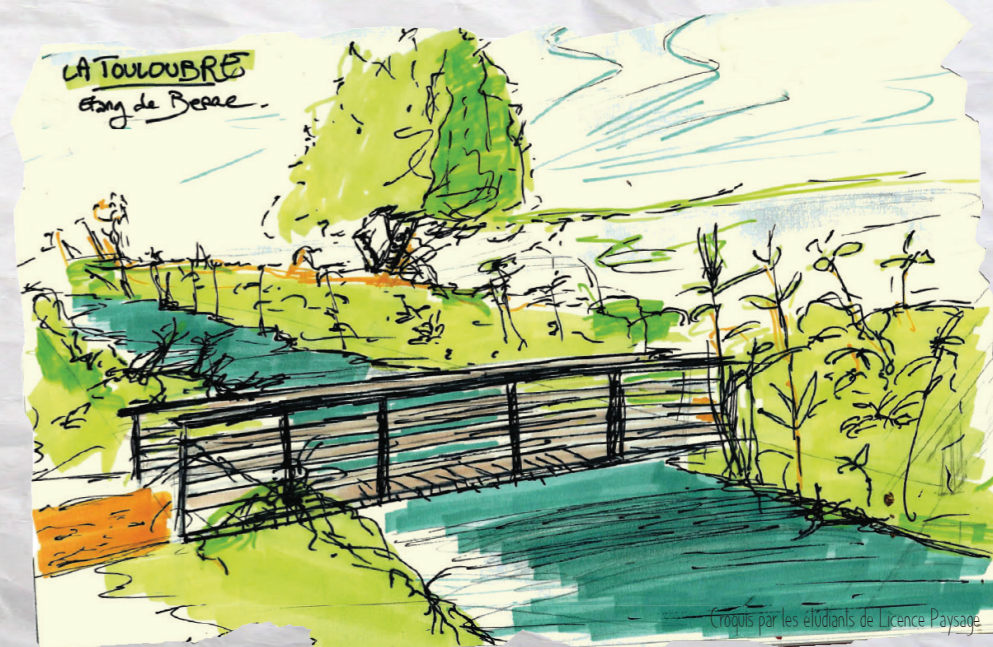
Croquis par les étudiants de Licence Paysage