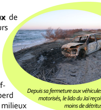
Depuis sa fermeture aux véhicules motorisés, le lido du Jai reçoit moins de débris

Gestion foncière trop hétérogène entre les gestionnaires des zones humides altérant les continuités écologiques.