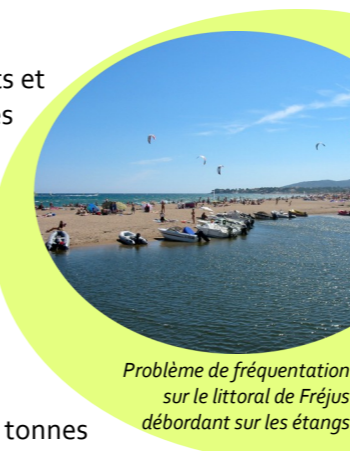
Problème de fréquentation sur le littoral de Fréjus débordant sur les étangs

Présence d'espèces invasives : herbe de la Pampa, chèvrefeuille du Japon, lampourde d'Italie, notamment sur le site Natura 2000 Embouchure de l'Argens.