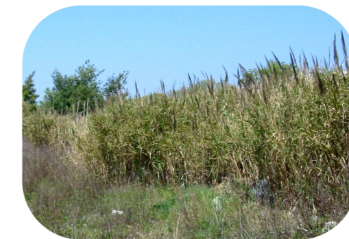
La Canne de Pline (seules stations en PACA)

* Espèce faisant l'objet d'un Plan National d'Action pour sa sauvegarde