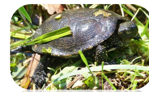
La Cistude d'Europe*, trouvant refuge sur plusieurs zone humides