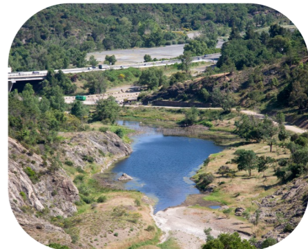
Zone humide de Malpasset