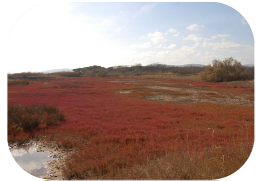
Salicornes sur la Base Nature de Fréjus

Les zones humides intérieures sont formées de marais et plans d'eau bordés de forêts galerie et de prairies humides . Sur le littoral, se trouvent des milieux humides à salinité variable, tels que les lagunes méditerranéennes (habitat naturel prioritaire au titre de Natura 2000), ceinturées de prés salés , fourrés de tamaris ou roselières .