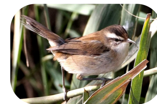
La Lusciniole à moustaches, espèce méditerranéenne

La ville de Fréjus accueille plusieurs espèces particulièrement rares et protégées, parmi lesquelles se trouvent :