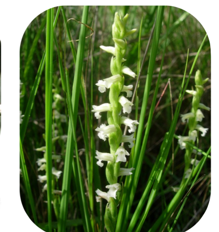
La Spiranthe d'été, présente en bordure des ruisseaux