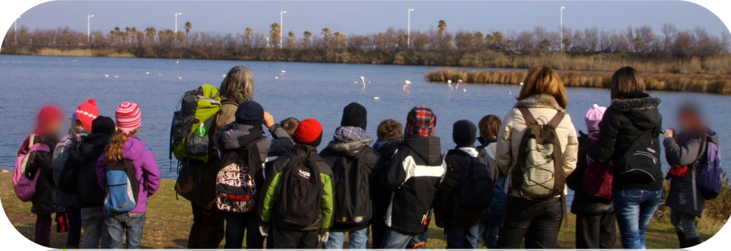
Sortie découverte des étangs de Villepey avec des groupes scolaires