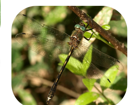
La Cordulie à corps fin, Inféodée aux milieux humides