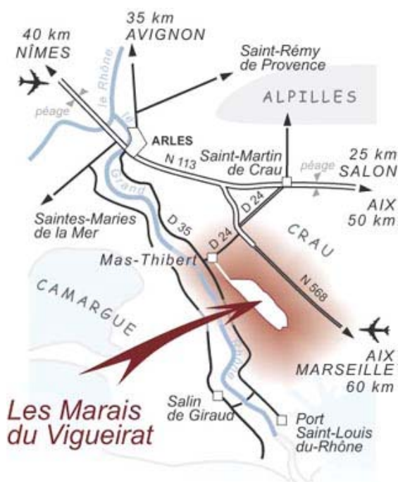
Les Marais du Vigueirat

Prix Spécial Jean-Roland « Réconcilier l'Homme et la nature » 2008 attribué par Réserves Naturelles de France Prix AGIR pour la planète 2008 décerné par la région PACA Prix Régional PACA de l'innovation touristique 2007 Prix Meilleure initiative Régionale PACA en Écodéveloppement (MIREILLE 2007)