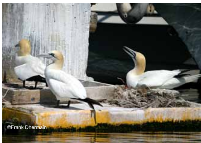
Fou de Bassan

Remarque : la Côte Bleue accueille depuis peu quelques couples qui tentent de nicher (un couple a élevé avec succès un jeune en 2006, ce qui constitue une première pour tout le Bassin méditerranéen !), et l'espèce est communément observée au large durant l'hiver.