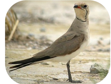
La Glaréole à collier, qui occupe les prairies humides de la commune