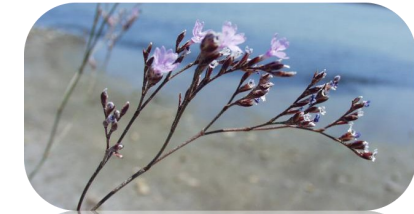
La Statice de Provence, se trouvant sur les salins