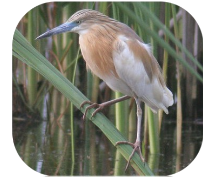
Le Crabier chevelu, observé sur les Pâtis