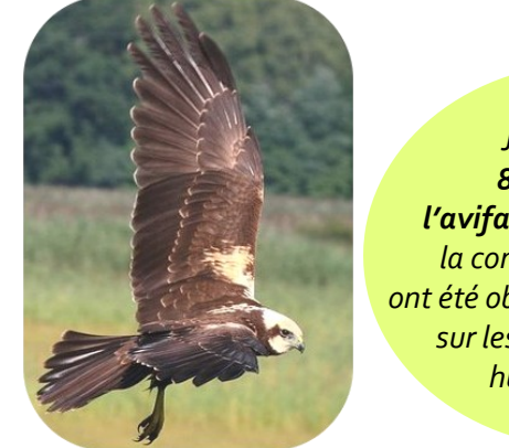
Le Busard des roseaux, espèce nicheuse

Jusqu'à 80% de l'avifaune de la commune ont été observés sur les zones humides