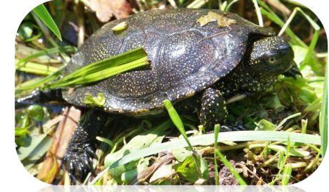
La Cistude d'Europe*, qui est présente sur le site des salins