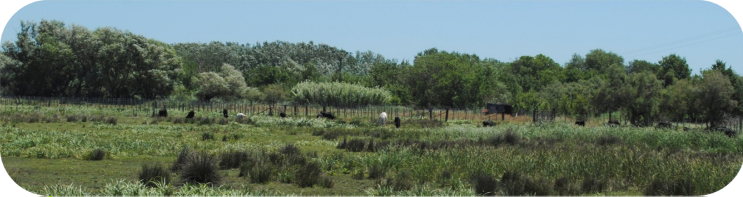
Le Marais du Sagnas forme une vaste et riche zone humide en bordure de l'étang de Berre