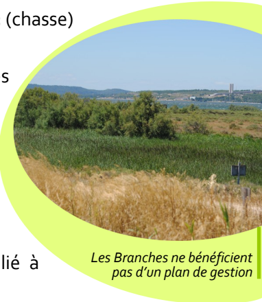
Les Branches ne bénéficient pas d'un plan de gestion

* Réacteur Expérimental Thermonucléaire International