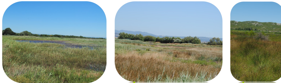
Les Pâtis, Les Pâtis, Font du Leu

Entre embouchure de l'Arc et salins, les zones humides de Berre l'étang présentent une grande diversité de milieux (tables salantes, prairies et pelouses plus ou moins salées, ripisylves, roselières), dont deux sont prioritaires au titre de Natura 2000 : les lagunes méditerranéennes et les steppes salées méditerranéennes .