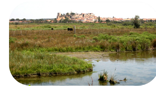
Le marais de la Sode