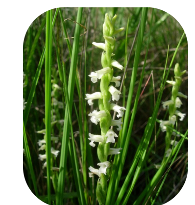
La Spiranthe d'été, se trouvant en Crau humide