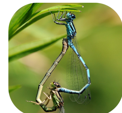
L'Agrion de Mercure*, espèce discrète