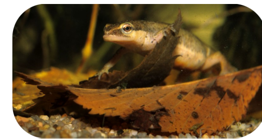
Le Triton palmé, qui trouve refuge en Crau humide