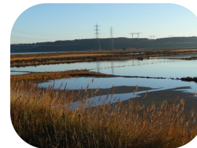
Anciens salins de Fos