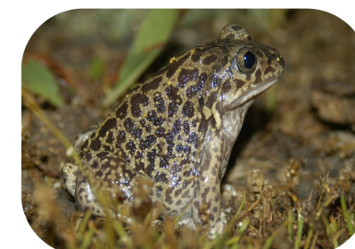
Le Pélobate cultripède, particulièrement menacé

Fos-sur-Mer abrite plusieurs espèces rares et protégées, de grande valeur patrimoniale, parmi lesquelles se trouvent :