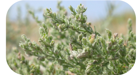
La Cresse de Crête, plante rare

Sur la commune de Martigues, plusieurs espèces d'intérêt patrimonial et protégées sont présentes :