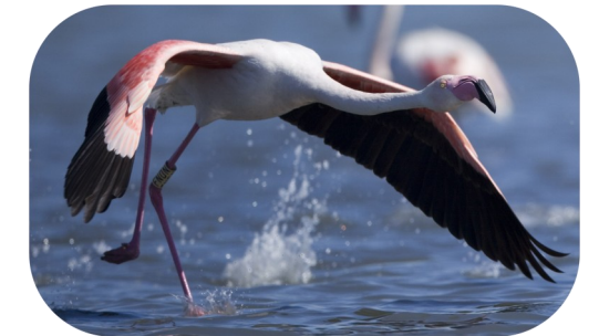
Le Flamant rose, espèce hivernante la plus remarquable

Vous trouvez que les limites sont imprécises et qu'elles ne respectent pas la réalité de terrain ? Il est donc nécessaire d'affiner l'inventaire des zones humides à l'échelle parcellaire sur votre commune, en tenant compte des critères réglementaires de délimitation.