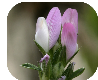
La Bugrane sans épine, endémique de Méditerranée

L'ensemble des zones humides de la commune se situe dans des secteurs à fort (voire très fort) enjeux pour la conservation de la faune et de la flore