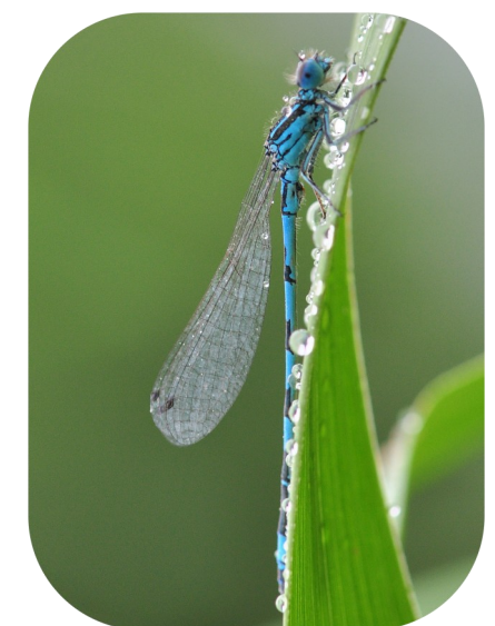
L'Agrion de Mercure*, observé dans le secteur de l'étang du Pourra

Port-de-Bouc accueille de nombreuses espèces de grand intérêt patrimonial, parmi lesquelles se trouvent :