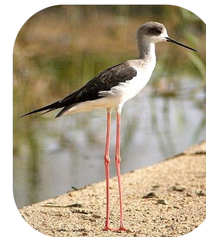
Une colonie d'Echasses blanches fréquente le site

Le Marais de la Tête Noire a un intérêt ornithologique majeur puisque près de 50% de l'avifaune de la commune y ont été observés