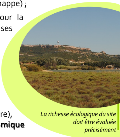
La richesse écologique du site doit être évaluée précisément

Valorisation patrimoniale (culturelle, paysagère), sociale (loisirs, chasse, pêche) et économique (agriculture, tourisme).