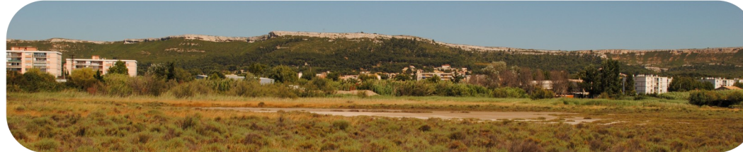
L'enclavement du Marais de la Tête Noire affecte ses fonctionnalités écologiques...

Direction départementale des territoires et de la mer (13), Service de l'environnement – 04 91 28 40 40 – ddtm@bouches-du-rhone.gouv.fr