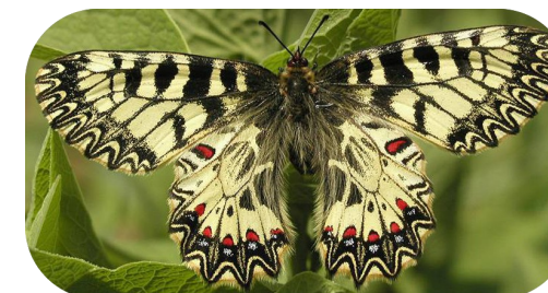
La Diane a été observée sur la zone humide

Malgré un manque de connaissances sur la zone, plusieurs espèces d'intérêt patrimonial y ont déjà été inventoriées :