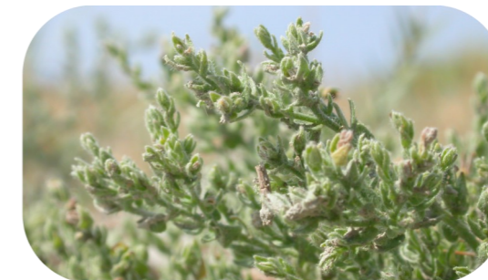
La Cresse de Crête, espèce méditerranéenne

Châteauneuf accueille de nombreuses espèces de grand intérêt patrimonial, parmi lesquelles se trouvent :