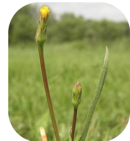
La rare Scorsonère à petites fleurs