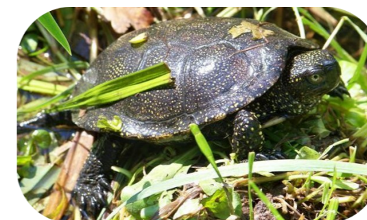
La remarquable Cistude d'Europe*, présente sur la Palun de Marignane

* Espèce faisant l'objet d'un Plan National d'Action pour sa sauvegarde