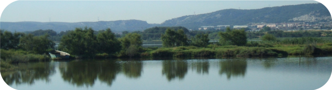
Les rives de l'étang de Bolmon offrent un cadre agréable pour les randonneurs...