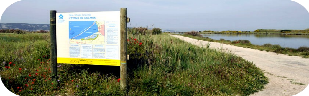
L'acquisition des zones humides par le Conservatoire du Littoral est garante de leur sauvegarde et doit être encouragée