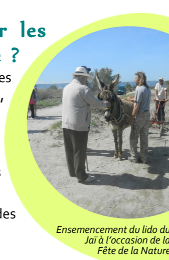
Ensemencement du lido du Jai à l'occasion de la Fête de la Nature

Maîtrise foncière hétérogène en défaveur des continuités écologiques.