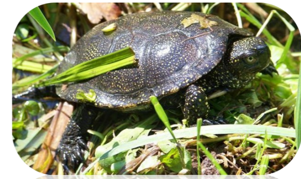
La Cistude d'Europe*, observée sur la Grande Palun de Marignane