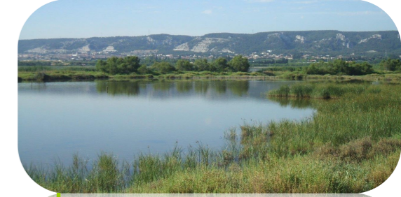
Paysage entre terre et eau depuis les bords du Bolmon