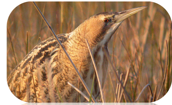
Le Butor étoilé*, espèce hivernante remarquable des zones humides