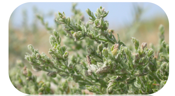
La Cresse de Crète, espèce méditerranéenne

Les zones humides périphériques à l'étang de Bolmon regroupent à elles seules près de 75 % des espèces oiseaux observées sur la commune.