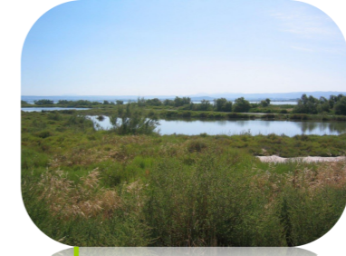
Sansouires du Bolmon