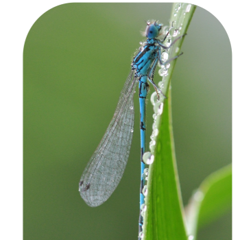
L'Agrion de Mercure*, fréquente la commune

Les zones humides sont menacées. Avec près de 27% de son territoire en zones humides – contre 3% en moyenne nationale – le département des Bouches-du-Rhône présente un caractère exceptionnel. Toutes les zones humides doivent être protégées en raison des fonctions qu'elles remplissent.