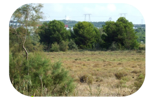
Pré salé sur le viaduc de Caronte