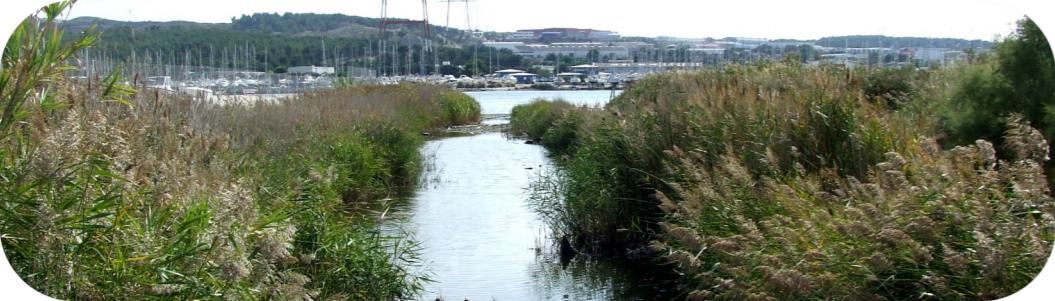
Enfermées dans le tissu industriel, les zones humides de Martigues doivent être préservées de toute dégradation