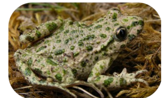
Le Pélodyte ponctué semble se reproduire sur certains mares

Vous trouvez que les limites sont imprécises et qu'elles ne respectent pas la réalité de terrain ? Il est donc nécessaire d'affiner l'inventaire des zones humides à l'échelle parcellaire sur votre commune, en tenant compte des critères réglementaires de délimitation.