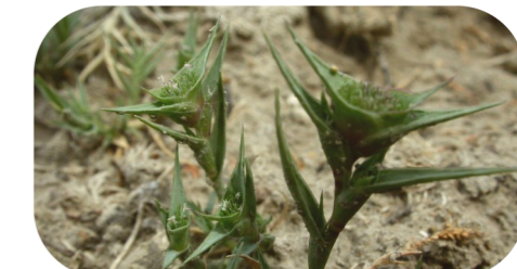
La très rare Crysippe piquante