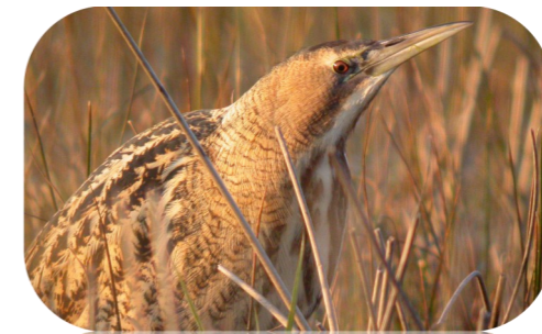
Le Butor étoilé*, espèce d'oiseau hivernante la plus remarquable