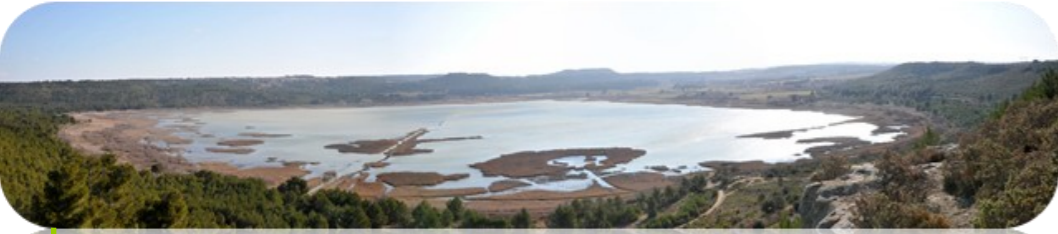
La diversité des milieux présents sur l'étang du Pourra explique sa richesse en espèces