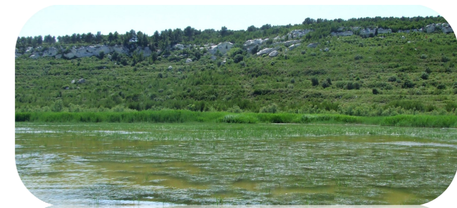
L'étang du Pourra présente une végétation aquatique et rivulaire diverse attirant de nombreuses espèces

La nature des milieux qui compose les zones humides de la commune est variée. Roselières, prairies humides, peuplements de tamaris, et prés salés offrent une grande diversité de paysages.