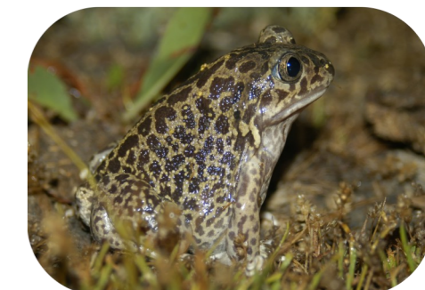
Le Pélobate cultripède, espèce particulièrement menacée