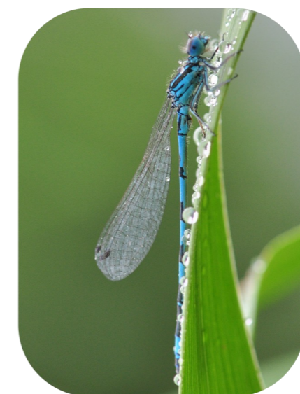
L'Agrion de Mercure*, observé dans le secteur de l'étang du Pourra

Port-de-Bouc accueille de nombreuses espèces de grand intérêt patrimonial, parmi lesquelles se trouvent :