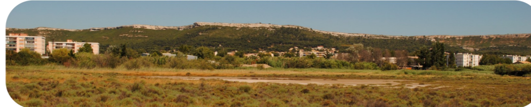
L'enclavement du Marais de la Tête Noire affecte ses fonctionnalités écologiques...

Direction départementale des territoires et de la mer (13), Service de l'environnement – 04 91 28 40 40 – ddtm@bouches-du-rhone.gouv.fr