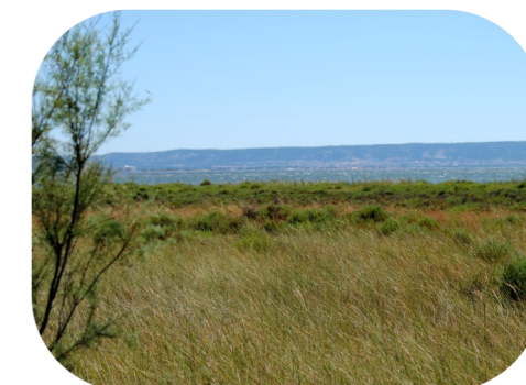
Vue sur l'étang de Berre