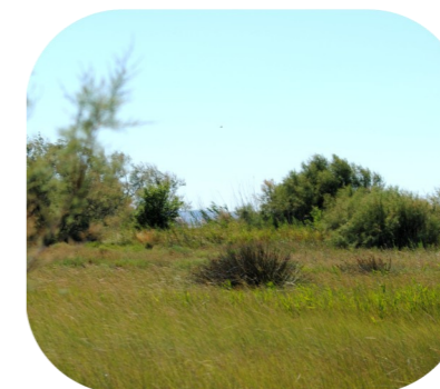
Prairie à joncs

Un ensemble de milieux aux conditions de salinité et de submersion variables ( marais, sansouires, roselières, prairies à joncs, ripisylve ) se juxtaposent sur la faible superficie du Marais de la Tête Noire, le rendant d'autant plus remarquable.