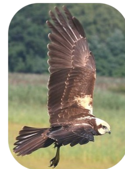
Un couple de Busards des roseaux niche sur le site

Vous trouvez que les limites sont imprécises et qu'elles ne respectent pas la réalité de terrain ?