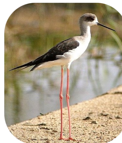
Une colonie d'Echasses blanches fréquente le site

Le Marais de la Tête Noire a un intérêt ornithologique majeur puisque près de 50% de l'avifaune de la commune y ont été observés