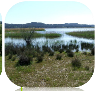
Bord de l'étang Pourra