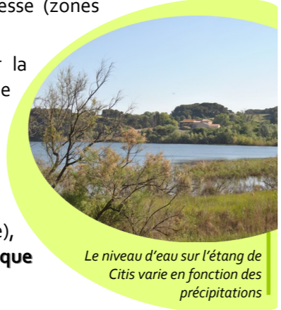
Le niveau d'eau sur l'étang de Citis varie en fonction des précipitations

Valorisation patrimoniale (culturelle, paysagère), sociale (loisirs, chasse, pêche) et économique (agriculture, tourisme).