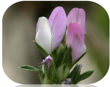
La Bugrane sans épine, espèce méditerranéenne

St Mitre-les-Remparts accueille de nombreuses espèces d'intérêt patrimonial, parmi lesquelles se trouvent :