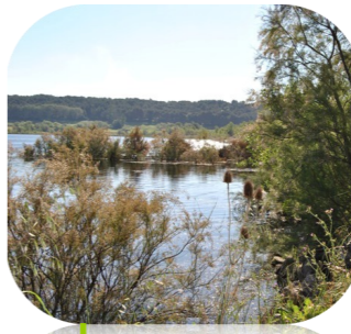
Etang de Citis

Les zones humides de St Mitre-les-Remparts sont de nature très variée, allant des étendues d'eaux douces à saumâtres, temporaires à permanentes. Les berges des étangs de Citis et du Pourra se composent de roselières, prairies humides, peuplements de tamaris et sansouires (autour du Pourra).