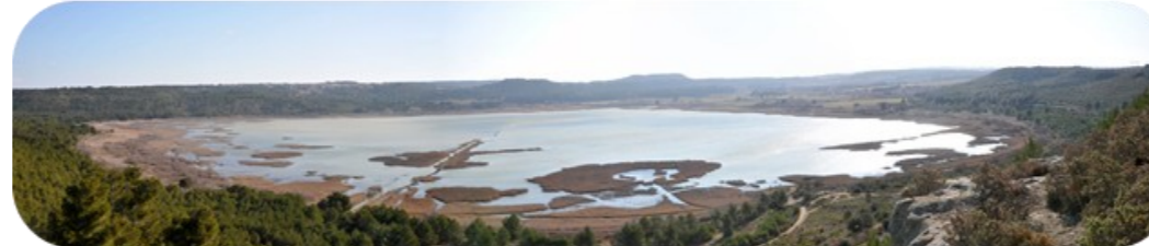
La diversité des milieux présents sur l'étang du Pourra explique sa richesse en espèces...

Dossier thématique disponible à l'adresse suivante : www.pole-lagunes.org/PAC-IZH