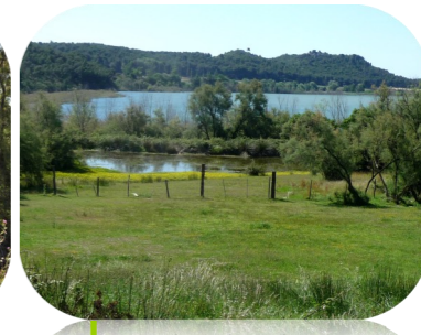
Prairie humide sur le Citis