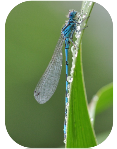
L'Agrion de Mercure* fréquente les milieux humides