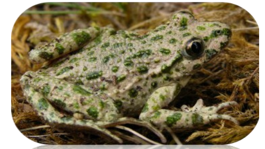
Le Péloïde ponctué, observé à l'étang du Pourra