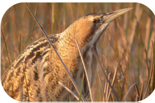
Le Butor étoilé*, un hivernant remarquable