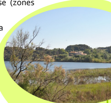
Le niveau d'eau sur l'étang de Citis varie en fonction des précipitations

Valorisation patrimoniale (culturelle, paysagère), sociale (loisirs, chasse, pêche) et économique (agriculture, tourisme).