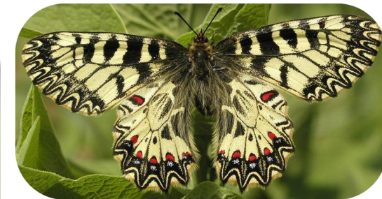
L'aristoloche à feuilles rondes, plante hôte de la Diane, papillon de jour remarquable

* Espèce faisant l'objet d'un Plan National d'Action pour sa sauvegarde