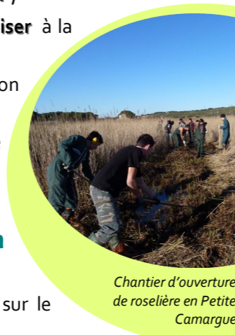
Chantier d'ouverture de roselière en Petite Camargue

En engageant des travaux de restauration , lorsque cela est nécessaire.