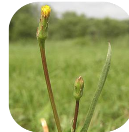
La Scorsonère à petites fleurs, espèce rare

St Chamas accueille plusieurs espèces de grande valeur écologique, parmi lesquelles se trouvent :