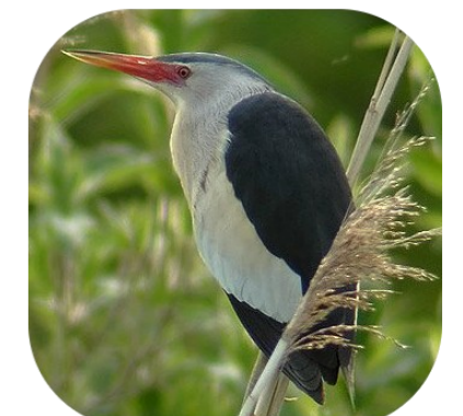
Le Bihoreau gris, qui niche en Petite Camargue