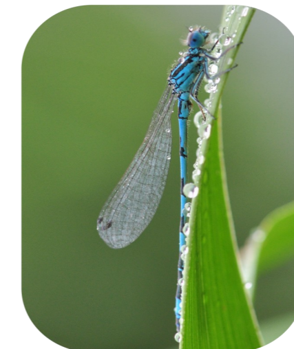
L'Agrion de Mercure*, fréquentant les milieux humides