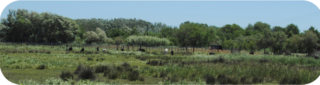
Le Marais du Sagnas forme une vaste et riche zone humide en bordure de l'étang de Berre.