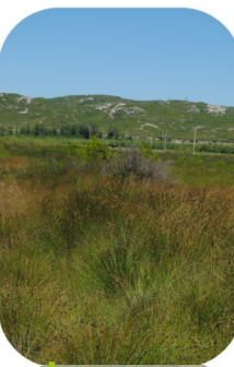
Font de Leu