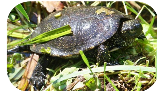
La remarquable Cistude d'Europe*, qui présente de grands enjeux de conservation