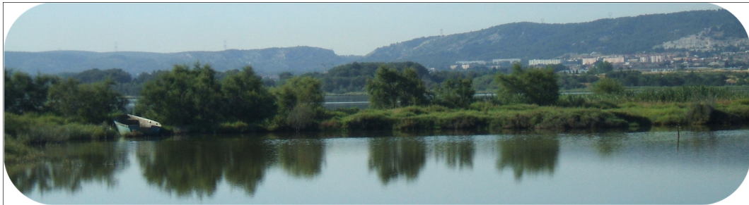
Les rives de l'étang de Bolmon offrent un cadre agréable pour les randonneurs...