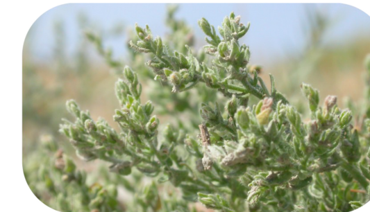
La Cresse de Crète, espèce méditerranéenne

Châteauneuf accueille de nombreuses espèces de grand intérêt patrimonial, parmi lesquelles se trouvent :