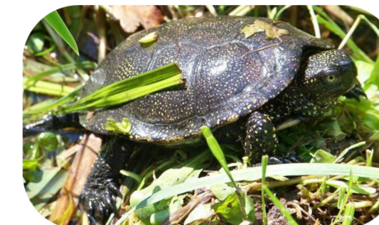
La remarquable Cistude d'Europe*, présente sur la Palun de Marignane

* Espèce faisant l'objet d'un Plan National d'Action pour sa sauvegarde