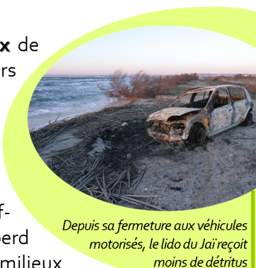
Depuis sa fermeture aux véhicules motorisés, le lido du Jaï reçoit moins de détritus

Gestion foncière trop hétérogène entre les gestionnaires des zones humides altérant les continuités écologiques.