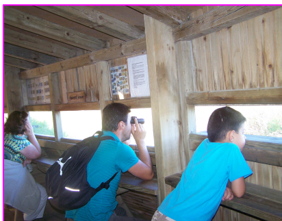
Observation sur l'étang de Berre

Sur l'Etang de Berre, l'association Ecoute ta Planète a valorisé la faune et la flore, à travers une balade de 1h30 et ses différentes étapes.