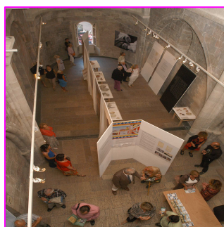
Exposition St Pierre de l'Almanarre