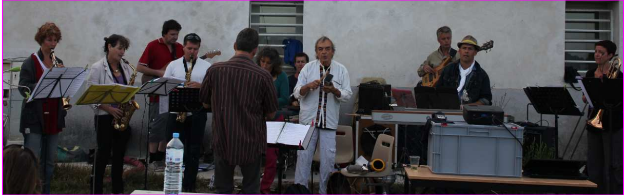
Ensemble Jazz des Why Notes

Aux Salines de Villeneuve, on a valorisé le patrimoine culinaire des étangs palavasiens, et aussi le patrimoine humain en musique ! Les animations sur ce site ont été réalisées par le Siel et le CEN L-R, co-gestionnaires du site, avec un total de plus de 200 personnes dans le week end !