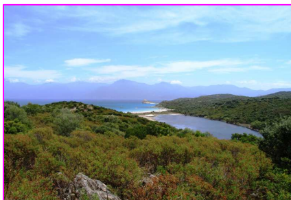
étang du LMotu