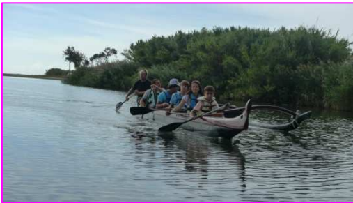
Vallée du Golo