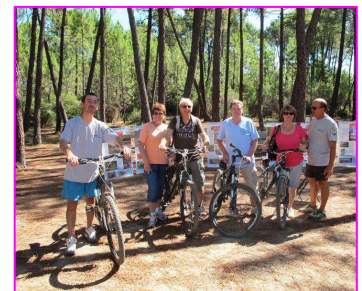
forêt de Pinia

Le Conseil Général de la Haute Corse a organisé une promenade autour de l'étang du Lotu, à pied et en bateau, et une randonnée VTT dans la forêt de Pinia sur 10km de littoral !