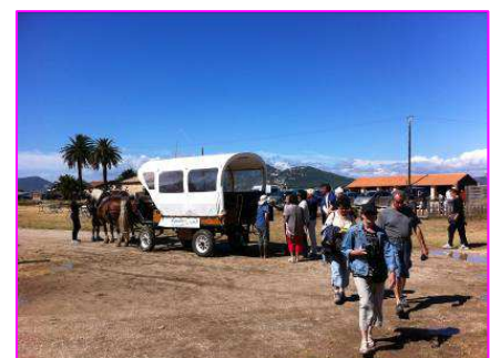
Visite des salins d'Hyères en calèche

Sur les Salins d'Hyères, plus de 2500 personnes ont participé aux animations organisées par la communauté d'agglomération de Toulon Provence Méditerranée et le Conservatoire du Littoral ! Itinéraire découverte, ornithologue de la LPO, visites guidées, promenades en calèche, ateliers, expositions... le site archéologique d'Olbia a été largement mis à l'honneur lors de ces deux journées !