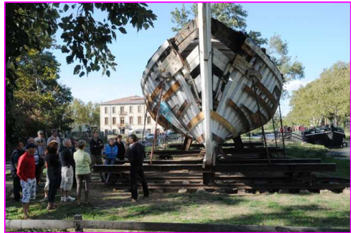
Goélette sur le chantier de marine

Le conservatoire maritime et fluvial des pays Narbonnais a mobilisé presque 500 personnes sur Sainte Lucie et Narbonne autour des restaurations en cours par les charpentiers de marine : un beau moment d'histoire vivante.