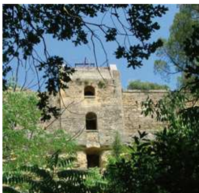
Poudrerie de Saint Chamas, étang de Berre