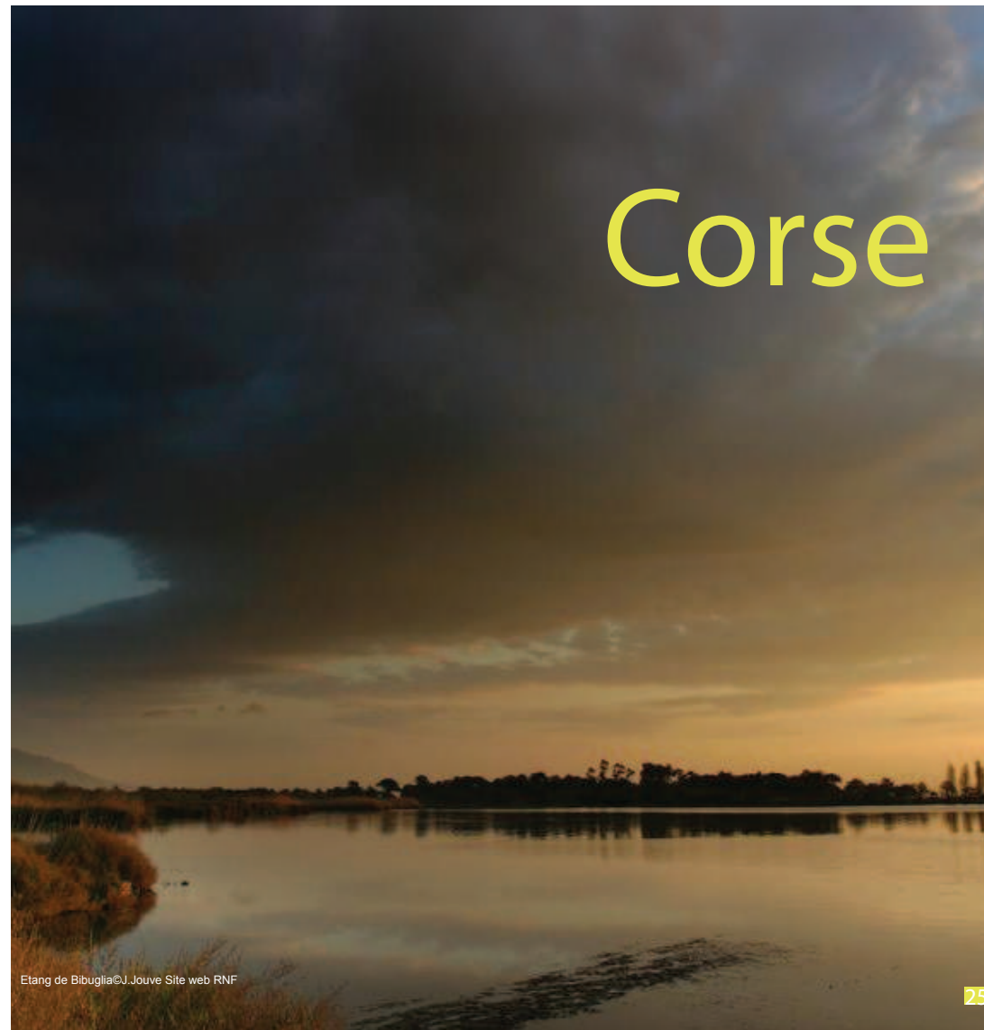
Étang de Bibuglia © J. Jouve Site web RNF