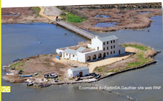
Ecomusée du FortinCA.Gauthier site web RNF

■ Réservation : obligatoire, au cours de la semaine qui précède la manifestation