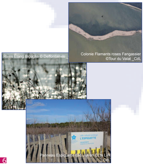
Rives Etang Biguglia Colonie Flamants roses Fangassier

EN 2015 LE CONSERVATOIRE DU LITTORAL ET SES PARTENAIRES CELEBRENT 40 ANS DE PROTECTION DU LITTORAL !