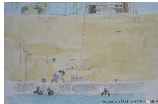
Aquarelle Michel ROBIN © MDA

Laissez-vous guider à travers la Petite & Grande Camargue, l'occasion de découvrir des richesses insoupçonnées.