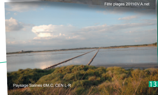
Paysage Salines