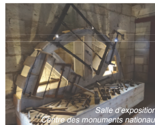
Salle d'exposition- Centre des monuments nationaux