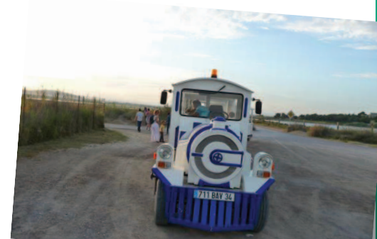
Fête plages 2011