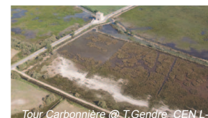
Tour Carbonnière @ T.Gendre. CEN L-R