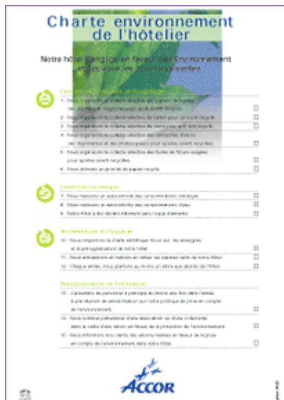
La Charte Environnement de l'hôtelier signée par les hôtels du groupe ACCOR.

La mise en place de la charte environnement de l'hôtelier (Annexe 1) avec ces quinze points d'actions est une suite logique de la politique environnementale menée par le Groupe.