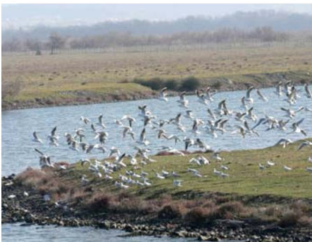
Observation de Mouettes lors de la sorties sur les abords de l'étang du Bolmon.

Les Journées Mondiales des Zones Humides restent un événement majeur en début d'année pour tout amoureux de la Nature. C'est également un rendez-vous incontournable pour les structures d'éducation et de sensibilisation à l'environnement.