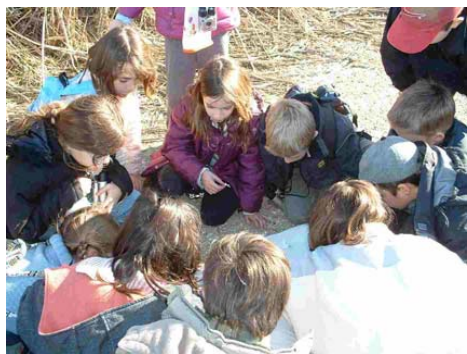
Atelier pour les enfants à la maison de la Nature de Lattes.

L'intérêt de ces journées est aussi de toucher un grand nombre de scolaires autour des grandes questions qui touchent l'eau, la préservation de la faune sauvage et de leurs habitats.