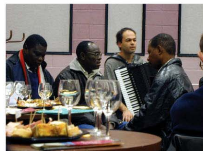
Le Bistrot du Parc du PNR de la Narbonnaise "Les originalités culturelles des zones humides" Le 3 février 2006