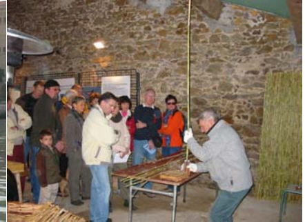
Exposition sur la récolte de la canne de Provence organisée par la mairie de Fréjus

Plusieurs rencontres entre acteurs de l'environnement et le public ont également permis de discuter de l'évolution des « métiers des zones humides » et des produits qu'ils valorisent . Pour les structures de gestion d'espaces naturels, c'était également l'occasion de présenter leur travail de réhabilitation ou de conservation de certaines zones humides ( exemples de la présentation du SIBOJAI sur le chantier de réhabilitation sur les étangs de Berre et du Bolmon ou du témoignage du gestionnaire des étangs de Villepey qui raconte le métier de garde de littoral ).