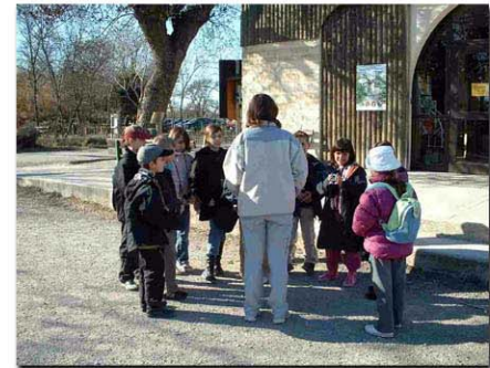
Animation pour les enfants : Jeu de piste à la Maison de la Nature de Lattes Le 1 er février 2006