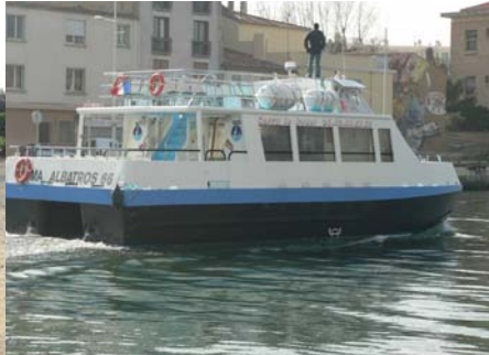
Balade en bateau sur l'étang de Berre et le canal du Rove, organisée par le SIBOJAI