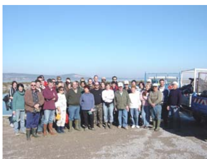
1 février : Matinée de nettoyage des étangs palavasiens organisée par le SIEL

La pression humaine exercée sur les différentes zones humides régionales est un thème qui a également été bien illustré par les structures d'éducation à l'environnement et de conservation de la nature. Celles-ci ont ainsi volontairement choisi de présenter l'impact humain et les actions à entreprendre pour limiter la dégradation des zones humides au travers d'une dizaine de manifestations (actions de nettoyage par des bénévoles, conférence-débat sur la fréquentation en zones humides, diaporama sur les menaces en zones humides). Plusieurs conférences-débats, tables-rondes ont ainsi permis de discuter de l'avenir des zones humides, de la qualité de l'eau et des milieux, ainsi que de la gestion à mettre en place pour conserver notre patrimoine naturel.