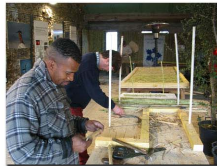
Exposition "Récolte de la canne de Provence" à la Ferme des Esclamandes, Fréjus Le 4 février 2006