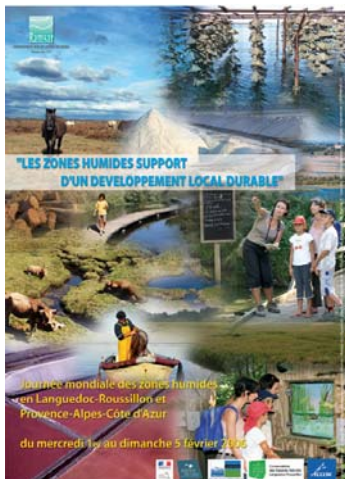
Affiche des JMZH 2006 réalisée par le pôle relais lagunes méditerranéennes

Comme en 2005, le pôle relais lagunes a souhaité adapter les supports de communication diffusés par le bureau de Ramsar au thème et aux zones humides rencontrées sur la façade méditerranéenne. L'affichage choisi pour illustrer le thème « les zones humides, support d'un développement local durable » reprend les couleurs et les activités rencontrées sur les lagunes, les marais, les salins, les tourbières et les cours d'eau ( Affiche des JMZH 2006 en annexe ).