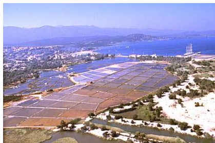
Saline à l'embouchure du Stabiacciu (Porto-Vecchio)

Cette manifestation s'est déroulée en deux fois sur deux sites pour que les décideurs locaux puissent s'exprimer sur les problématiques qui touchent plus spécifiquement leur territoire.