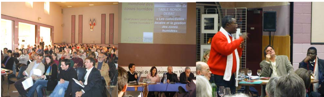
Journée de sensibilisation des décideurs au PNR de la Narbonnaise. Table ronde sur les collectivités locales et la gestion des zones humides et discussion au Bistrot du Parc portant sur les originalités culturelles des zones humides.

Cette journée de sensibilisation a été ponctuées par une série de trois conférences sur les valeurs, menaces et protection des zones humides, suivie d'une table-ronde où se sont échangées les expériences des collectivités sur la préservation des lagunes et les autres zones humides, les difficultés rencontrées dans leur gestion et la valorisation qu'il est possible de mettre en place. En fin de journée, le bistrot du parc a réuni une centaine de personne dans une ambiance conviviale, autour d'une dégustation de produits du terroir et une présentation des « originalités culturelles des zones humides ». Cette manifestation s'est achevée par la remise du diplôme Ramsar au PNR de la Narbonnaise (cf. programme de la journée en annexe).