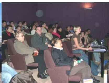
2 février : Conférence du CEN L-R sur les fonctions et valeurs des zones humides