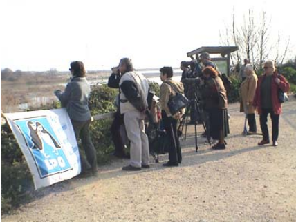
Permanence ornithologique du groupe Valbonne de la LPO le 4 février à l'embouchure du Var

Plus de 2300 personnes se sont immergées dans l'univers des activités traditionnelles des Camarguais ( découverte de l'élevage en calèche ou de la pêche traditionnelle de l'anguille en barque sur l'étang du Vaccarès, la récolte de la canne de Provence dans le Var, la récolte du sel à Salins de Giraud.. ) et ont découvert la beauté des paysages et la diversité de l'avifaune des étangs, et des zones humides estuariennes des fleuves côtiers (Rhône, Durance, Var).