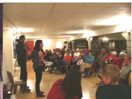
4 février : Animation du PNR de la Narbonnaise : les contes de la Nadière