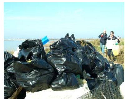
Samedi 4 février : Nettoyage réalisé par les hôtels du groupe Accor sur le site des salins du Castellans.