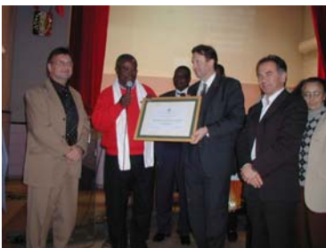
Remise du diplôme Ramsar au PNR de la Narbonnaise

Il a fallu 4 années de montage du projet pour la désignation des étangs de la Narbonnaise (étangs de Campagnol, de l'Ayrolle, de Gruissan, de Bages-Sigean et de La Palme) à l'inventaire Ramsar. Le pôle relais lagunes et le Syndicat Mixte du PNR de la Narbonnaise se sont pleinement investis pour l'obtention de cette labellisation.