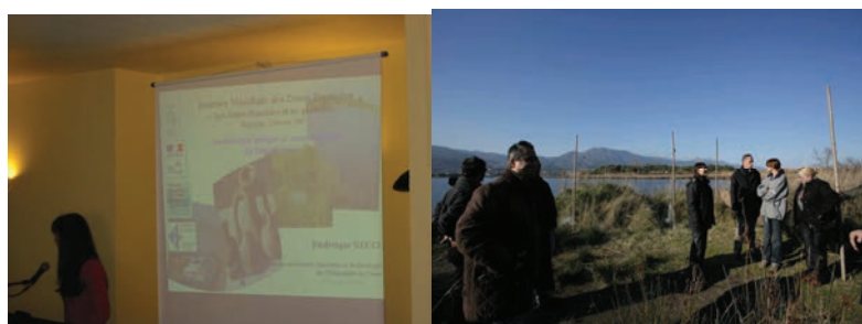
Journée du 2 février à l'étang de Biguglia, OEC, 2007.

Après un buffet sur les lieux du séminaire, une visite de la Réserve Naturelle de l'étang de Biguglia présentée par les services du Département de la Haute Corse (gestionnaire du site) a clôturé cette journée.