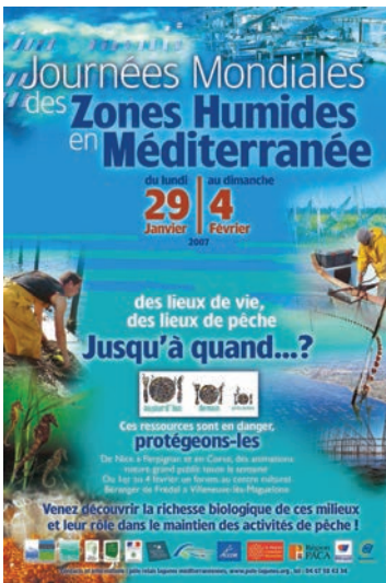
Affiche des JMZH 2007 ( Pôle relais lagunes méditerranéennes / Opus Sud)

Comme en 2006, le pôle relais lagunes a souhaité adapter les supports de communication diffusés par le bureau de Ramsar au thème proposé et aux spécificités des zones humides rencontrées sur la façade méditerranéenne.