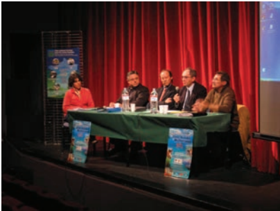
Conférence de la journée du 1 er février 2007