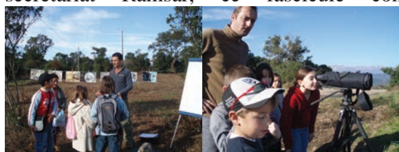
Sortie pédagogique sur l'étang de Palo, AAPNRC, 2007

Chaque élève est reparti avec un petit fascicule pédagogique sur la thématique de la pêche. Initié par le secrétariat Ramsar, ce fascicule contenait des poissons à colorier, découper et plier.