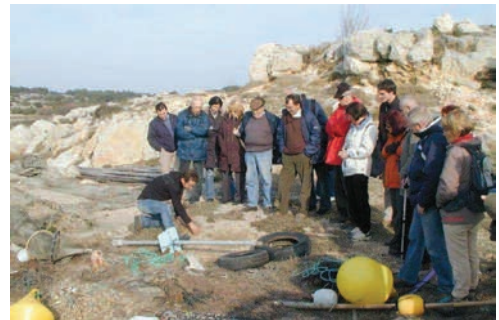
Animation RIVAGE à Leucate