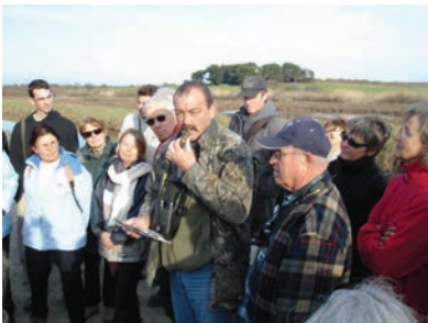
Animation SIEL/ Réserve de l'Estagnol

Les animations ont ainsi souvent couplé observation de la faune et de la flore spécifique aux zones humides et rencontre avec des professionnels de la pêche ou de la conchyliculture. Une dégustation des produits des lagunes a souvent été mise en place.