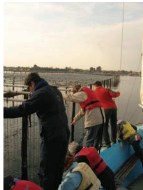
Animation ARDAM / étang de Thau