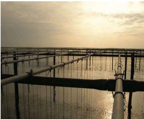
Sortie sur les tables conchylicoles de l'étang de Thau

Les Journées Mondiales des Zones Humides restent un événement majeur en début d'année pour tous les amoureux de la Nature. C'est également un rendez-vous immanquable pour les structures d'éducation à l'environnement et les gestionnaires des zones humides.