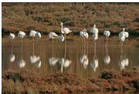
Salins d'Hyères : Photo A. SIMON/TPM

Etangs, lagunes, marais salants, mares, marais, ruisseaux, tourbières, vallées alluviales, prairies inondables... Les zones humides ont leur journée mondiale. Elle a lieu le 2 février, jour de l'anniversaire de la convention sur les zones humides, connue sous le nom de « Convention de Ramsar », du nom de la ville d'Iran où elle fut signée le 2 février 1971.