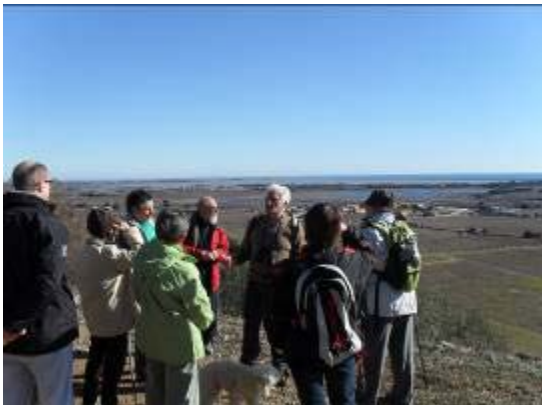
Présentation des marais et salins de Frontignan depuis le Massif de la Gardiole – Animation JMJM.

Au bilan, c'est près de 50 structures qui ont organisé et maintenu plus d'une soixantaine d'activités (découverte et sorties nature, expositions photos et techniques, ateliers artistiques et pédagogiques pour les enfants, conférences, soirées thématiques, dégustation des produits des lagunes, diaporamas, etc.). Elles ont eu lieu en majorité sur les zones humides littorales .