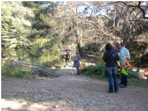
Animation « Le lac retrouvé de Carqueiranne » Mer-Nature, Provence.

Le programme de la journée du 6 février s'est déroulé en 2 temps : conférence le matin sur « Changement climatique, vers une nouvelle dynamique du delta du Rhône - Quelles stratégies d'adaptation, de gestion envisager ? », et balade sur le terrain l'après-midi. Un pique-nique et un verre de l'amitié a été offert aux visiteurs et intervenants, par les organisateurs (Cpie du pays d'Arles et le domaine de la Palissade). « En ajoutant à ce moment convivial, la qualité des présentations, les conditions météorologiques favorables, la douceur de la lumière de février, tout cela a permis de passer une agréable journée ... ».