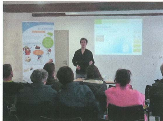
Sortie en bordure d'étang et conférence « Demain, mon jardin sans pesticides ».