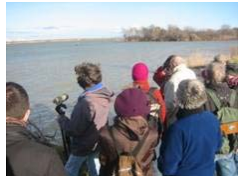
Sortie Nature sur le domaine de la Palissade (Salins de Giraud).

Les animations ont eu lieu sur les zones humides de Camargue, les marais des Baux de Provence, l'étang du Pourra dans les Bouches-du-Rhône, une mare à Carqueiranne et les salins d'Hyères dans le Var.