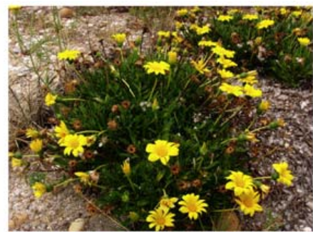
Griffes de sorcière ( Carpobrotus sp.), Séneçon en arbre ( Baccharis halimifolia ) et Gazania rigens

Afin de passer à l'action dans le cadre des JMZH 2010, le CEN L-R et ses partenaires le Syndicat Mixte RIVAGE, le Syndicat Mixte de la Camargue gardoise ont souhaité mettre en place deux chantiers impliquant le groupe Accor, partenaire du Pôle lagunes depuis 5 ans pour cet évènement.