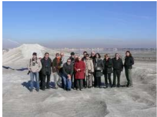
A la découverte du Sel de Camargue. Animation Nature et Culture proposée par le groupe Salins.

Grâce au temps agréable de ce mois de février, près de 1250 personnes dont 277 enfants ont participé à ces journées en Languedoc-Roussillon, et ont profité des nombreuses sorties nature ouvertes à tous. Les animations en intérieur (conférence, ateliers...) ont également permis de réunir bon nombre de participants autour de la thématique de l'année.