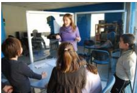
Atelier de sensibilisation pour les jeunes.

Cette année plus de 60 structures (gestionnaires de zones humides, structures d'éducation à l'environnement, collectivités...) ont bénéficié d'un soutien financier en répondant à l'appel à projet diffusé par le Pôle lagunes. Plus de 80 animations gratuites et ouvertes au public ont eu lieu dans les trois régions méditerranéennes.