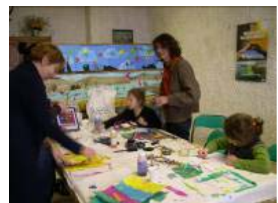
Atelier couleurs et collages pour enfants – Toi du Monde

- l'atelier créatif proposé par l'association « Toi du Monde » a permis à une quinzaine d'enfants d'exprimer leur créativité et leur sensibilité sur une fresque représentant les zones humides autour des étangs de Gruissan. Un discours d'éducation à l'environnement et de sensibilisation au changement climatique accompagnait cette animation.