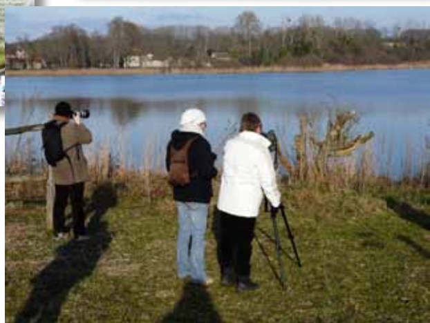
Le Rivallin - Maison de l'Environnement 77

3% du territoire français (France métropolitaine) est couvert par des zones humides