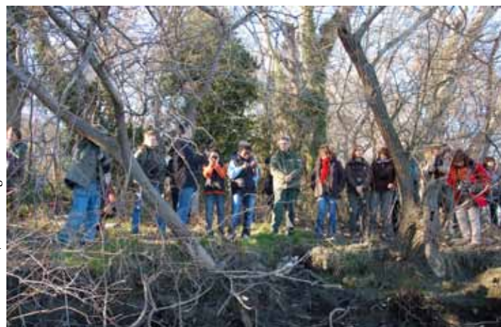
M. Cervilla/PNR Camargue

Année internationale des forêts oblige, les forêts alluviales étaient au coeur de nombreuses animations cette années. A cette occasion, le Parc naturel régional de Camargue proposait de découvrir les ripisylves du Rhône