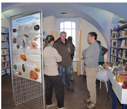
Légende photo 1 : une partie de l'exposition « mares du Cœur d'Hérault »