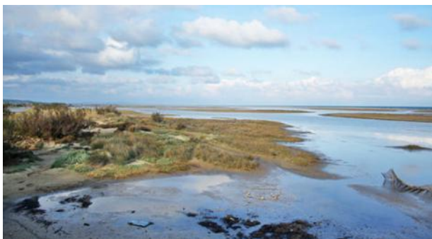
Légendes : Panorama des zones humides des Coussoules à La Franqui