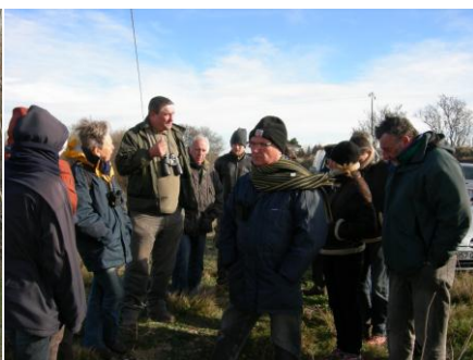
Légende photo 3 : Sortie Vendres : temple de Vénus