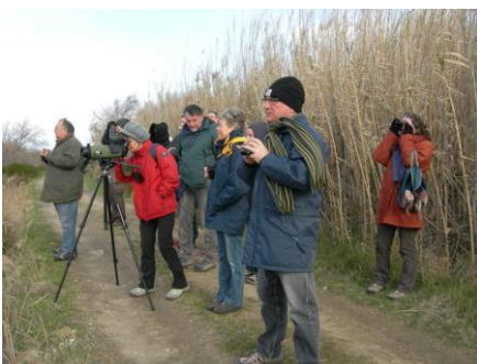
Légende photo 2 : Sortie Vendres : observation