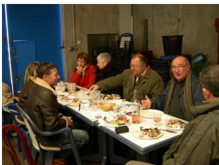
Légende photo 1 : Sortie Vendres : dégustation