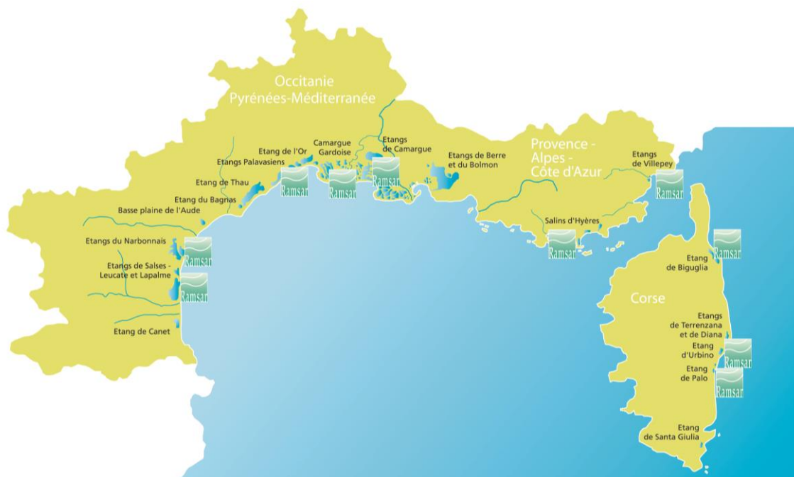
- Carte de localisation : principales lagunes méditerranéennes françaises.

Au regard de ces risques, comment les jeunes générations et le grand public en général se projettent dans l'interaction villes-zones humides ? Comment utiliser et optimiser les zones humides pour rendre les villes de demain plus résilientes ?