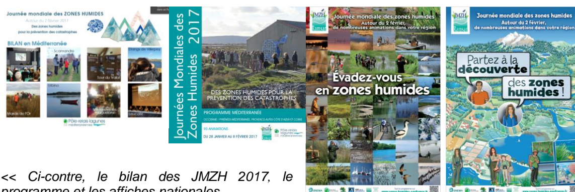
<< Ci-contre, le bilan des JMZH 2017, le programme et les affiches nationales

Depuis 2005, les bilans de cet évènement sont diffusés largement aux acteurs des lagunes, au niveau national sur le Portail national ZH et auprès des bureaux de la convention Ramsar.