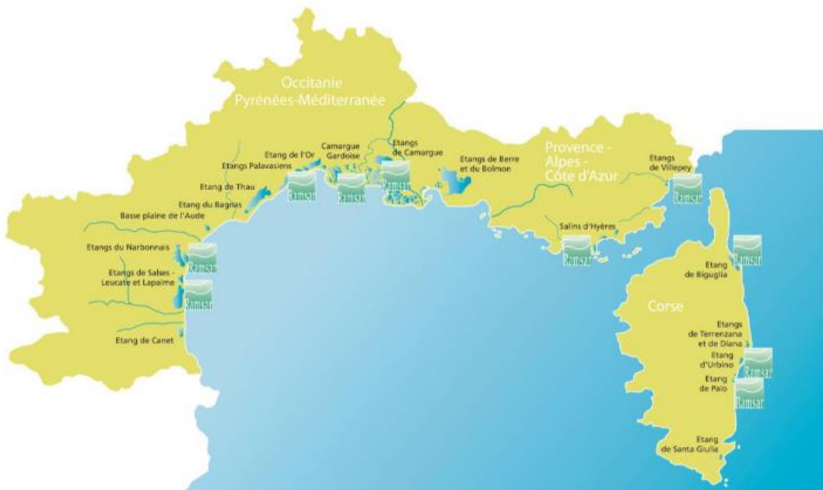
- Carte de localisation des principales lagunes méditerranéennes françaises

http://www.zones-humides.org/agir/ramsar-et-la-journee-mondiale-des-zones-humides/