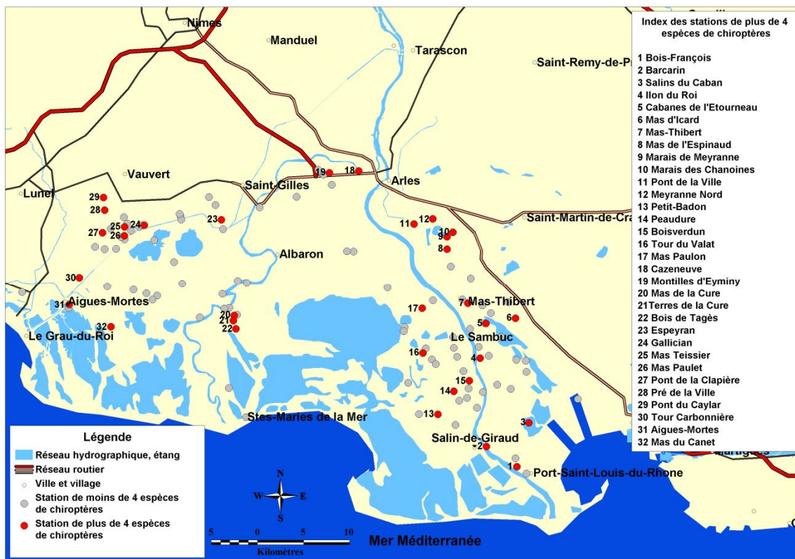
Figure 1 : Cartographie des sites d'observation de Chiroptères en Camargue pendant la période 1995-2005.