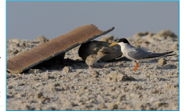
Sterne naine et poussin - îlot de nidification en gypse

Sur le salin d'Aigues-Mortes, en décembre 2008, les Salins du Midi ont signé un Contrat Natura 2000 pour favoriser l'accueil d'oiseaux menacés à l'échelle de l'Europe . Trente-deux îlots de nidification et plusieurs aménagements devront être réalisés pour des espèces de sternes, de mouettes, l'Avocette élégante et le Goéland railleur d'ici 5 ans en échange d'une contrepartie financière. La définition de ces actions a été réalisée grâce à la collaboration de l'Association des Amis des Marais du Vigueirat.