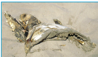
Carapace de tortue retrouvée sur la plage des salins

L'information a aussitôt été transmise au Centre d'étude et de sauvegarde des tortues marines en Méditerranée (Cestmed) basé au Grau du Roi.