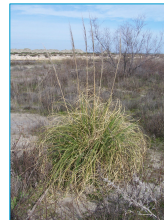
Herbe de la pampa

Un autre Contrat Natura 2000 est en cours de préparation pour éliminer les plantes envahissantes (diagnostic en cours par la Tour du Valat). Ces espèces, comme l'Herbe de la pampa ou la Griffes de sorcière, ont tendance à se développer dans le milieu naturel au détriment d'autres végétaux, ce qui entraîne une diminution de la biodiversité.