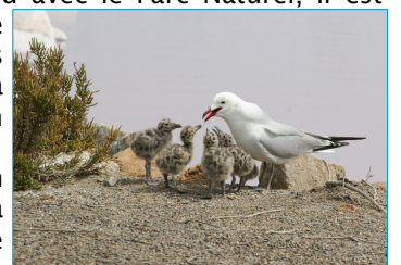
Goéland d'Audouin - Lagunas de Torrevieja

D'autres zones du salin seront plus favorables à l'accueil de cette espèce protégée et rare en Europe.