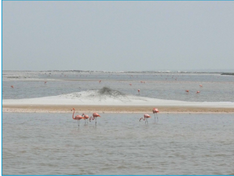
Flamant des Caraïbes - salin « Las Coloradas »

Le Groupe Salins a participé à cette conférence en présentant un article sur la gestion des salins méditerranéens en tant qu'espaces protégés. Cette manifestation a été l'occasion de visiter le salin d'YSYSA « Las Coloradas » dans l'Etat du Yucatan et de voir d'autres espèces d'oiseaux.