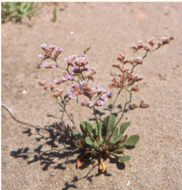
Saladelle de Girard.

❁ La Saladelle de Narbonne ( Limonium narbonense ), avec ses hampes florales élevées et denses de fin d'été et d'automne