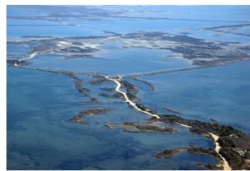
Vue aérienne sur les étangs du salin

Les Salins du Midi proposent depuis 2009 une nouvelle façon de visiter le salin d'Aigues-Mortes. Pendant 3 heures, un guide naturaliste vous fait découvrir la production de sel, les fabuleux paysages du salin, les oiseaux...un voyage original des tables salantes jusqu'à la mer!