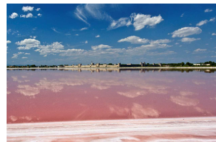
Remparts et salin d'Aigues-mortes

A quoi sert le sel ? D'où vient la fleur de sel? Quel est le travail du saunier? Pourquoi l'eau des tables salantes est-elle rose ?