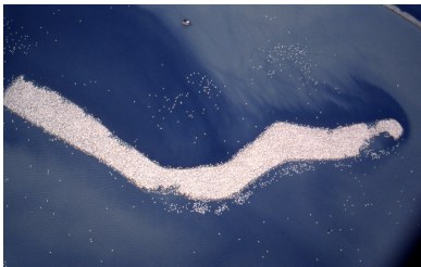
Îlot de reproduction des flamants—étang du Fangassier

Sur le salin de Giraud, les sauniers continuent à assurer l'alimentation et la reprise des eaux salées de l'étang du Fangassier, propriété du Conservatoire du Littoral depuis 2008 et gérée actuellement par le Parc Naturel Régional de Camargue . Cette année, de nombreux oiseaux ont été observés sur cet étang qui représente toujours l'unique zone de reproduction des Flamants roses en France.