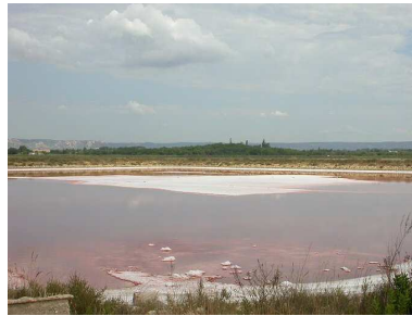
Vue sur le salin de Berre (~520 ha)

Le salin de Berre fait partie des 2 seuls sites abritant l'espèce en Provence : 1 à 3 couples s'y reproduisent régulièrement.