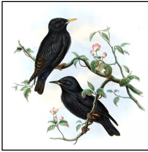
Couple d'Étourneaux unicolores Sturnus unicolor

Le salin de Berre fait partie des 2 seuls sites abritant l'espèce en Provence : 1 à 3 couples s'y reproduisent régulièrement.