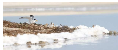
Sternes naines et poussins sur un îlot de reproduction dans un étang très salé

Quels sont les oiseaux observés et le lien avec la production de sel ? Quel est le rôle du salin dans la préservation de la biodiversité?