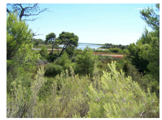
Forêt de pins au bord de mer

Le guide pourra répondre à toutes vos questions.