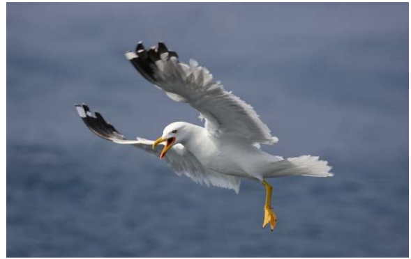
Le Goéland leucophée colonise les sites propices à la reproduction et exclut par compétition les autres espèces

Elles comprennent également des actions pour limiter le dérangement par le Goéland leucophée, espèce qui accapare de nombreuses ressources et dont les effectifs ont fortement augmenté ces 25 dernières années. Il colonise la plupart des sites propices à la reproduction et exclut par compétition les autres espèces. De plus, son comportement prédateur peut avoir un effet dévastateur sur les œufs et les poussins des autres espèces d'oiseaux d'eau.