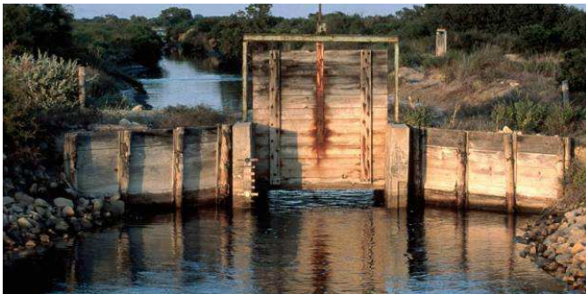
Restauration de 16 martelières

Le suivi de l'état de conservation des lagunes côtières salicoles et des populations d'oiseaux associés permettra d'évaluer l'efficacité de ces actions.