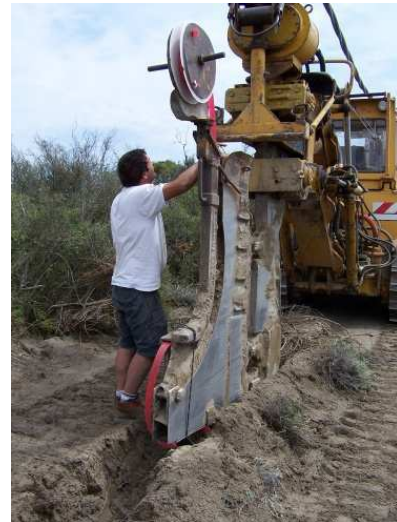
Machine utilisée pour enfouir les 3,5 km de câbles

Il s'agit d'enfouir une portion de ligne électrique d'une longueur de 3,5 km pour éviter les problèmes de collision des Flamants roses avec les câbles, ainsi que la dégradation régulière des habitats naturels à proximité (incendies). Cette action améliorera également la qualité paysagère pour la visite touristique du Salin.