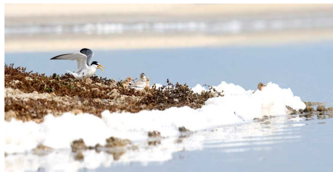
Sterne naine : adultes et poussins sur un îlot de reproduction

Le budget global du projet pour l'ensemble des sites concernés s'élève à 5 millions €. Pour les actions prévues sur le Salin d'Aigues-Mortes, le budget est de 744 000 €, dont 40% subventionnés par l'Europe. D'autres demandes de subvention sont en cours. Le Groupe Salins prendra à sa charge l'écart du budget dans le cadre de sa politique de développement responsable et de son engagement en matière d'environnement.