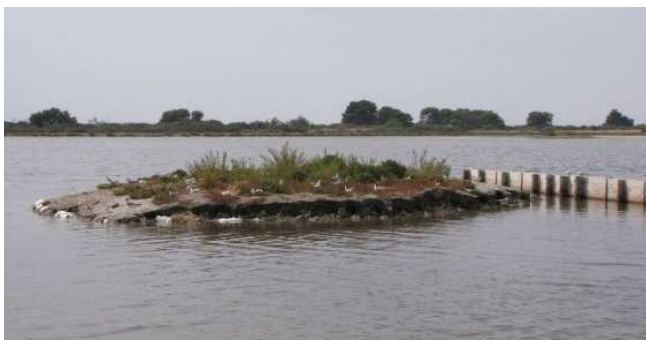
Ilot de nidification créé pour les oiseaux d'intérêt communautaire

Ces mesures consistent en la création et la restauration d'îlots de nidification.