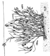
Herbetier lagunaire à ruppia