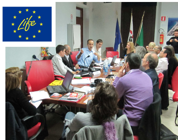
Réunion technique des partenaires le 5 décembre 2011

Le premier atelier de travail, organisé par le Parc Naturel Régional de Molentargius-Saline à Cagliari en Sardaigne, les 5 et 6 décembre 2011, a réuni tous les partenaires du projet : le Parc Naturel Régional de Molentargius-Saline, le Parc Régional du delta du Pô d'Emilie-Romagne (Italie), les Salins du Midi, le Parc Naturel Régional de Camargue, la Tour du Valat et l'ONG Green Balkans (Bulgarie). Chaque partenaire a d'abord présenté les actions prévues, puis une réunion technique a permis de préciser les modalités de gestion administrative, technique et financière du projet LIFE NATURE.