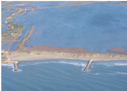
Epis sur le salin d'Aigues Mortes

La Compagnie des Salins du Midi a mis en place dans les années 80 des épis, des digues et des brise-lames, afin de limiter le recul du trait de côte. Le résultat de ces aménagements expérimentaux n'a malheureusement pas donné tous les résultats escomptés. De nouvelles solutions seront très prochainement étudiées pour tenter d'améliorer la situation : les efforts dans ce sens ne faiblissent pas.