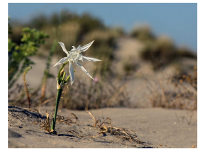
Lis de mer

L'Oyat ( Ammophila arenaria ) permet de fixer et de maintenir les dunes. L'Euphorbe péplis ( Euphorbia peplis ), plante très rare et protégée en France, est observée sur le haut de la plage. Le Lis de mer ( Pancretium maritimum ), espèce protégée en Région PACA, fleurit en période estivale.