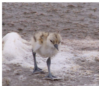
Avocette élégante : poussin

La société Cotusal, filiale du Groupe Salins en Tunisie, a créé trois nouveaux sites de nidification sur le salin de Sfax (1.700 ha) pour favoriser les conditions d'accueil des sternes, de l'Avocette élégante (795 couples en 2011) et du Goéland railleur (7.325 couples en 2011).