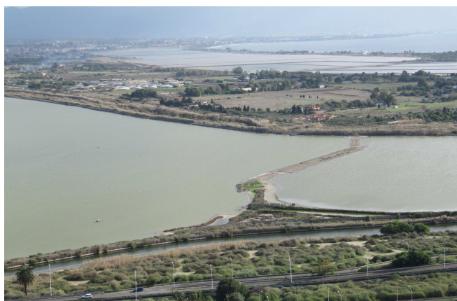
Le salin de Molentargius

Cette rencontre a aussi été l'occasion pour le Parc Naturel Régional de Molentargius-Saline de présenter concrètement sur le terrain les actions prévues sur le salin de Molentargius, qui n'est plus exploité pour la production de sel. Des travaux de restauration hydraulique doivent permettre d'améliorer l'état de conservation écologique des lagunes. Un nouveau canal d'entrée d'eau de mer sera créé et des digues seront rénovées pour garantir le gradient de salinité des lagunes. Le site accueille de nombreuses espèces d'oiseaux et en particulier 2.000 couples de Flamants roses. Afin d'améliorer leurs conditions de reproduction, de nouveaux îlots seront créés.