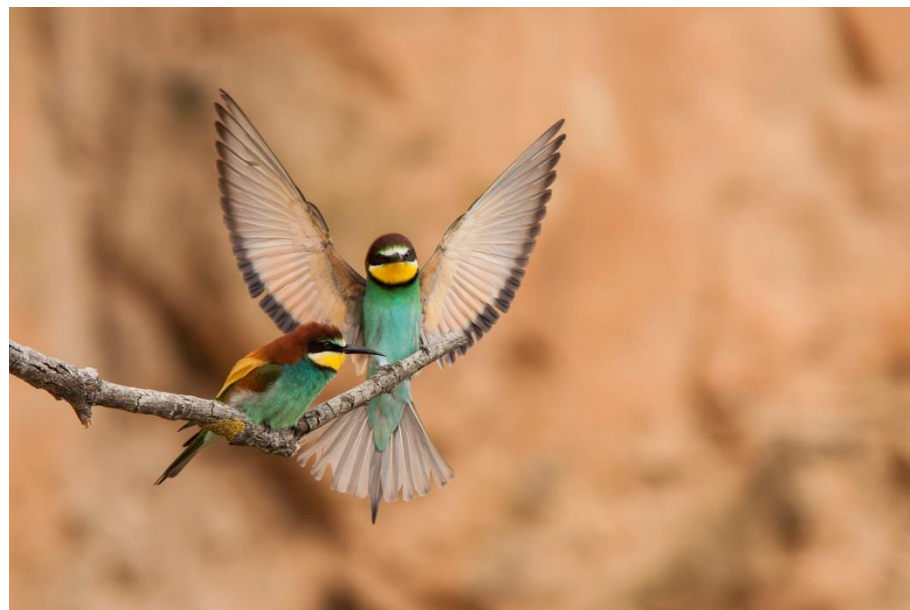
Exposition « Ailes de garrigues »