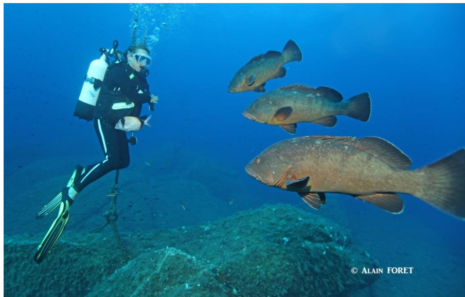
Exposition « Du Bassin de Thau à la Méditerranée »