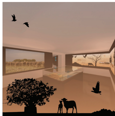
Une nouvelle scénographie à l'Ecomusée de la Crau (13)