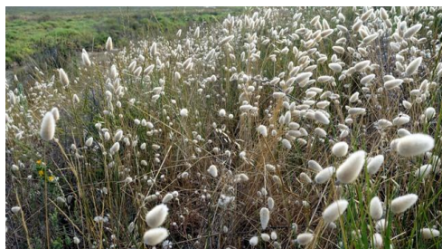
Capelière et Gacholle – les photos de J. Leunens

http://www.reserve-camargue.org/Capeliere-et-Gacholle-les-photos