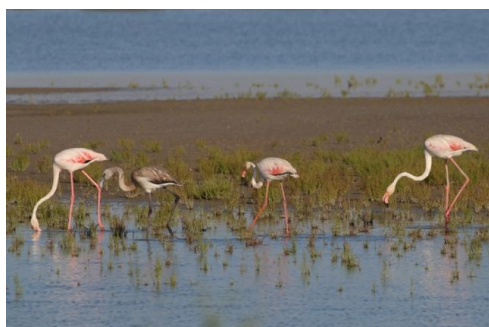
Été 2015 - les photos de Silke Befeld

http://www.reserve-camargue.org/Capeliere-et-Gacholle-les-photos