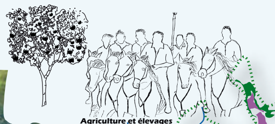
Agriculture et élevages