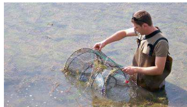
Table ronde 3 : Lutte contre les espèces envahissantes