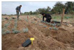
Table ronde 1 : Restauration de milieux lagunaires, périlagunaires et dunaires

Les trois thématiques pilotes du projet seront traitées successivement :