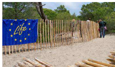
Table ronde 2 : Gestion de la fréquentation