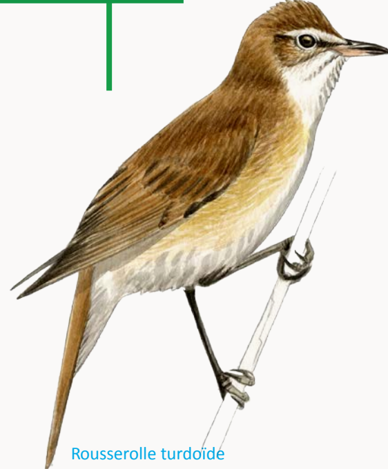
Rousserolle turdoïde Great Reed Warbler