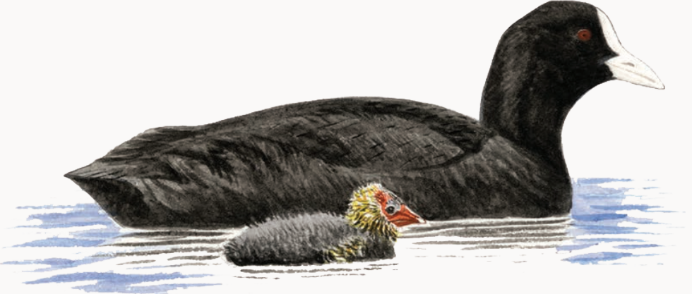
Foulque macroule Coot