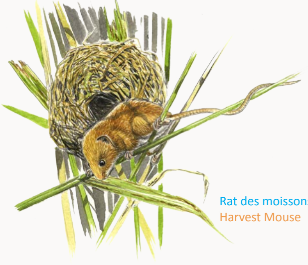
Rat des moissons Harvest Mouse