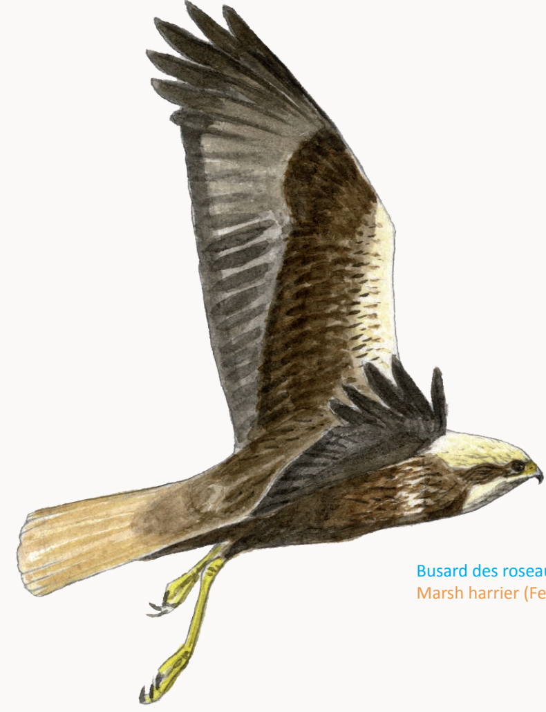
Busard des roseaux femelle Marsh harrier (Female)