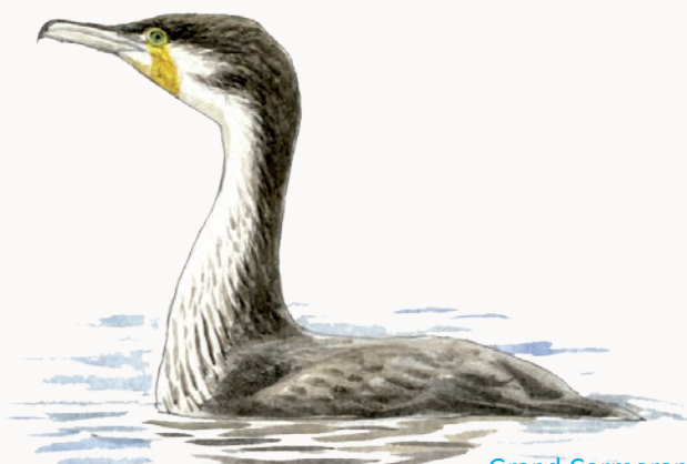
Grand Cormoran Cormorant