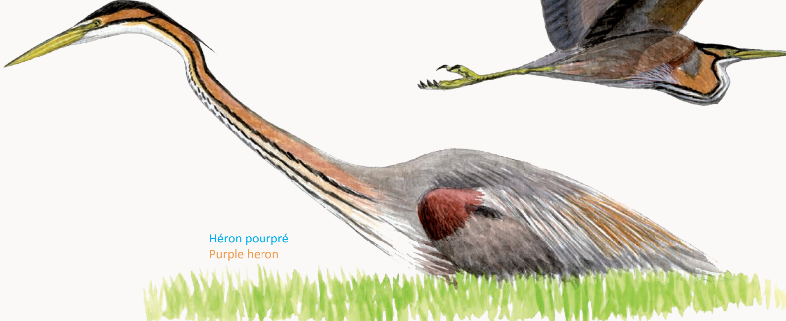
Héron pourpré Purple heron