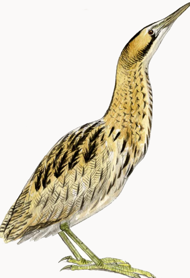
Butor étoilé Bittern