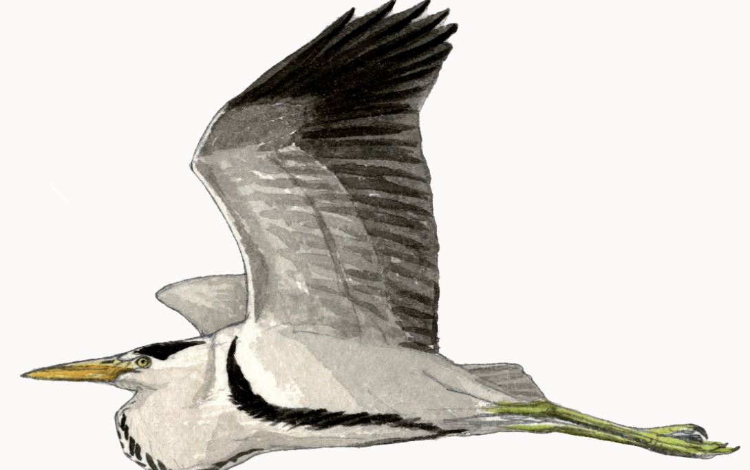
Héron cendré Grey heron