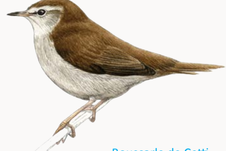
Bouscarle de Cetti Cetti's Warbler