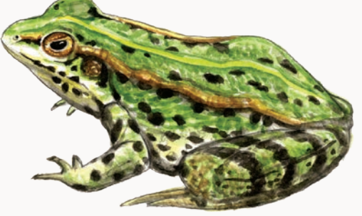
Grenouille verte Green Frog

Un circuit est disponible en scannant ce code :