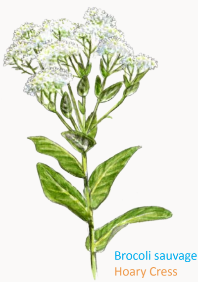
Brocoli sauvage Hoary Cress