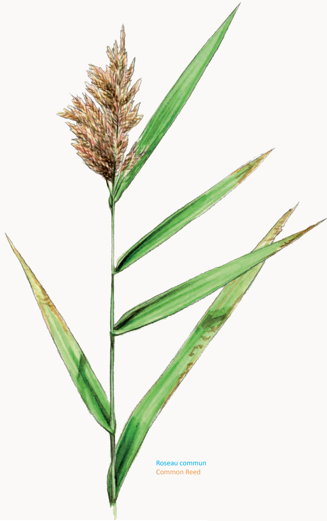
Roseau commun Common Reed

À proximité de l'étang se trouve un bâtiment, le «cabanon», qui servait autrefois de pêcherie à la pisciculture qui occupait l'ensemble des marais. Un carnet du site vous y attend pour noter les espèces observées.