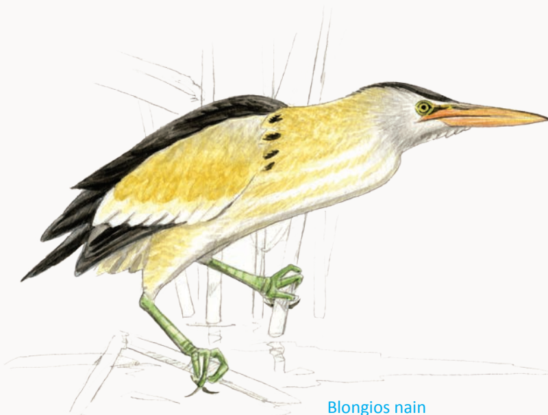
Blongios nain Little bittern