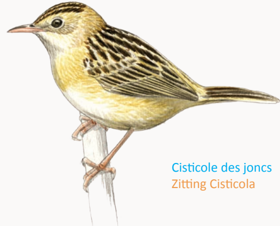
Cisticole des joncs Zitting Cisticola