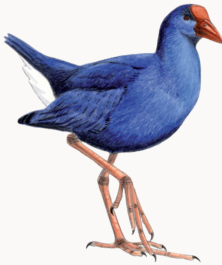
Talève sultane Purple gallinule