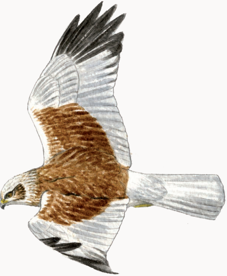
Busard des roseaux mâle Marsh harrier (Male)