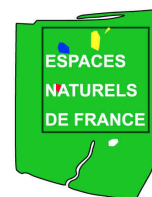
Conservatoire des Espaces Naturels du Languedoc - Roussillon