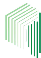
OFFICE DE L'ENVIRONNEMENT DE LA CORSE