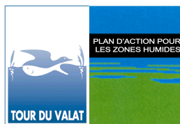
Pôle relais lagunes méditerranéennes

Tour du Valat Le Sambuc 13200 ARLES Tél : 04 90 97 20 13