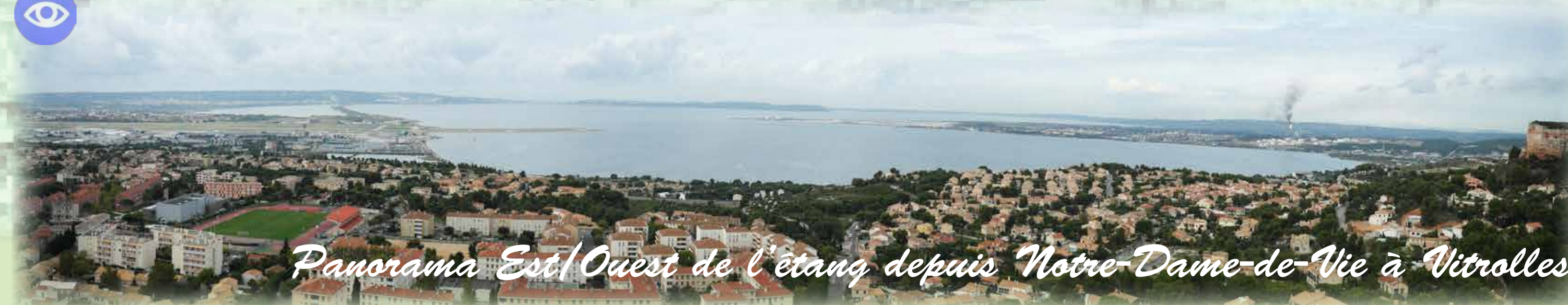
Panorama Est/Ouest de l'étang depuis Notre-Dame-de-Vie à Vitrolles.