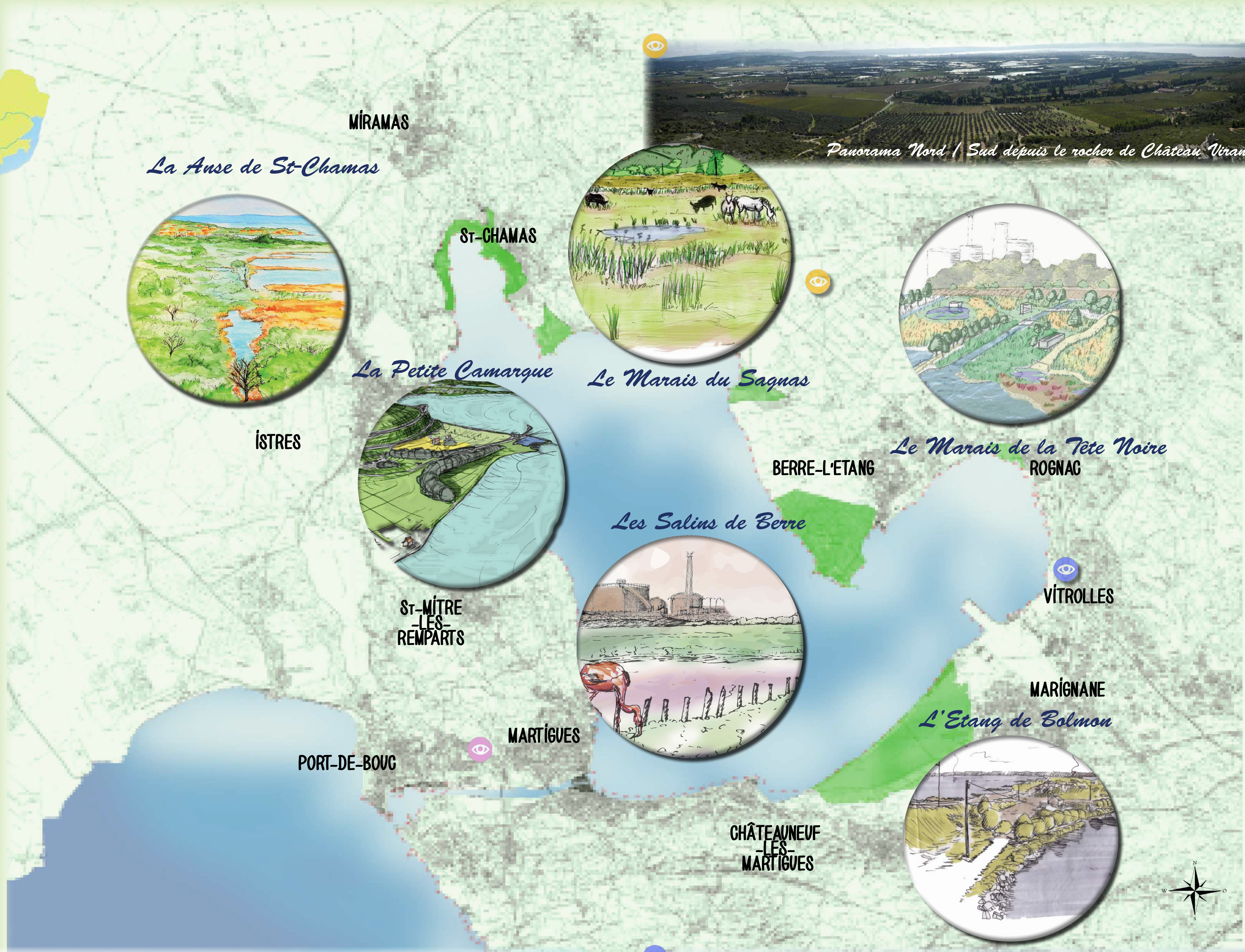
Panorama Nord / Sud depuis le rocher de Château Vérant.