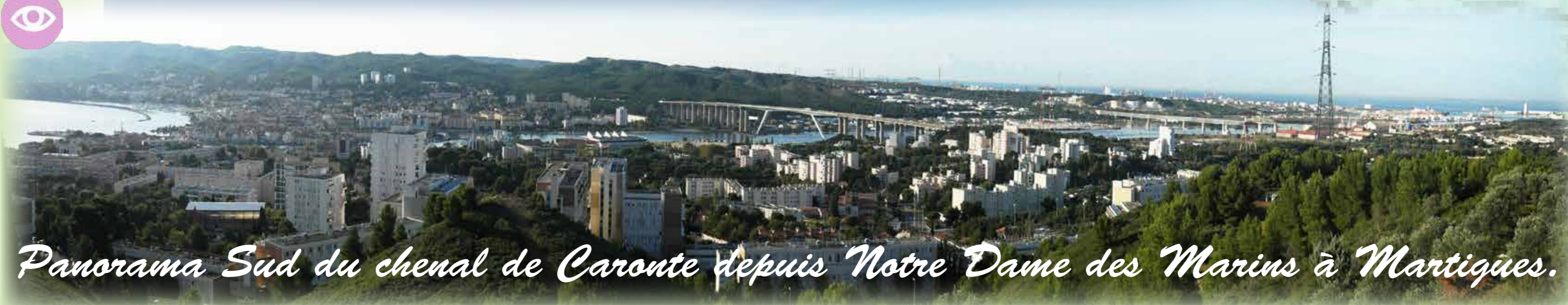
Panorama Sud du chenal de Caronte depuis Notre Dame des Marins à Martigues.