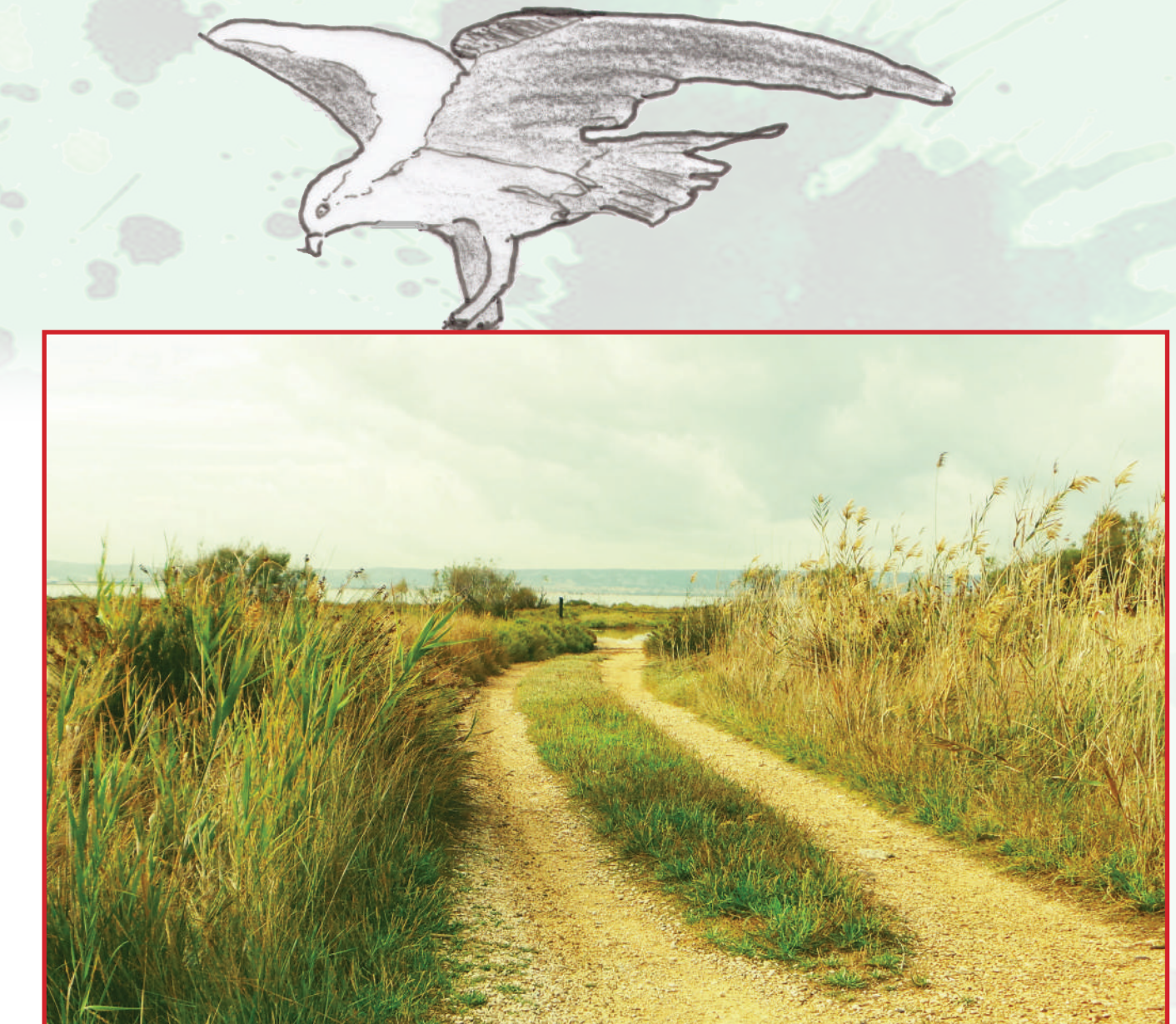
Découverte du marais par le sentier, nous pouvons entrevoir l'étang.

Une entrée isolée depuis laquelle on ignore complètement l'existence de ce marais. Les végétaux nous surplombent et les bruits s'amenuisent. Nous entrons dans un cocon isolé phoniquement de l'industrie et des routes voisines. La végétation s'abaisse pour laisser place aux sansouïres, perles de rubis et d'émeraudes, annonçant l'étang somptueux qui se tient désormais devant nous.