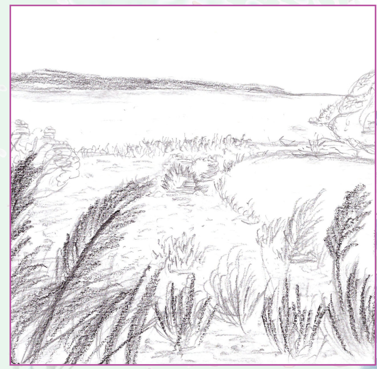
« Après ce périple, l'étang se tient devant nous ... »