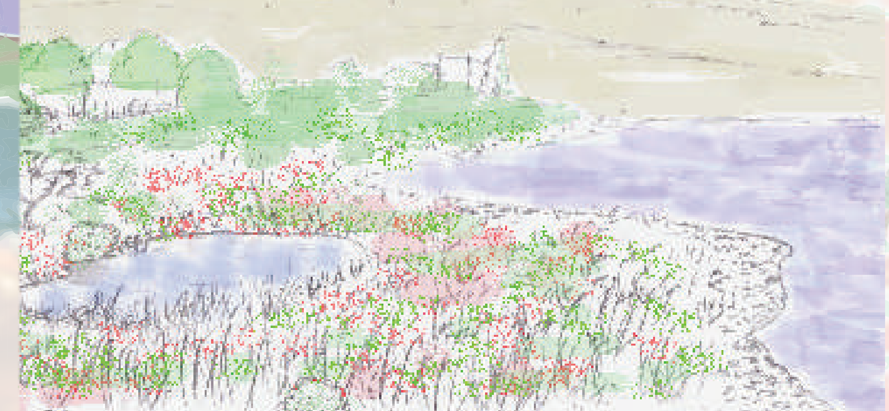
Avalanche de rubis, d'émeraudes et de saphirs, ainsi se dessinent les sansouïres.