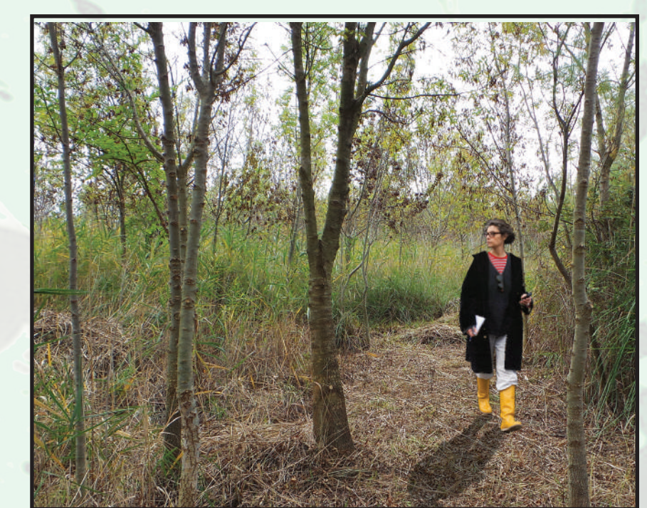
La frênaie, unique témoin d'un pastoralisme passé.