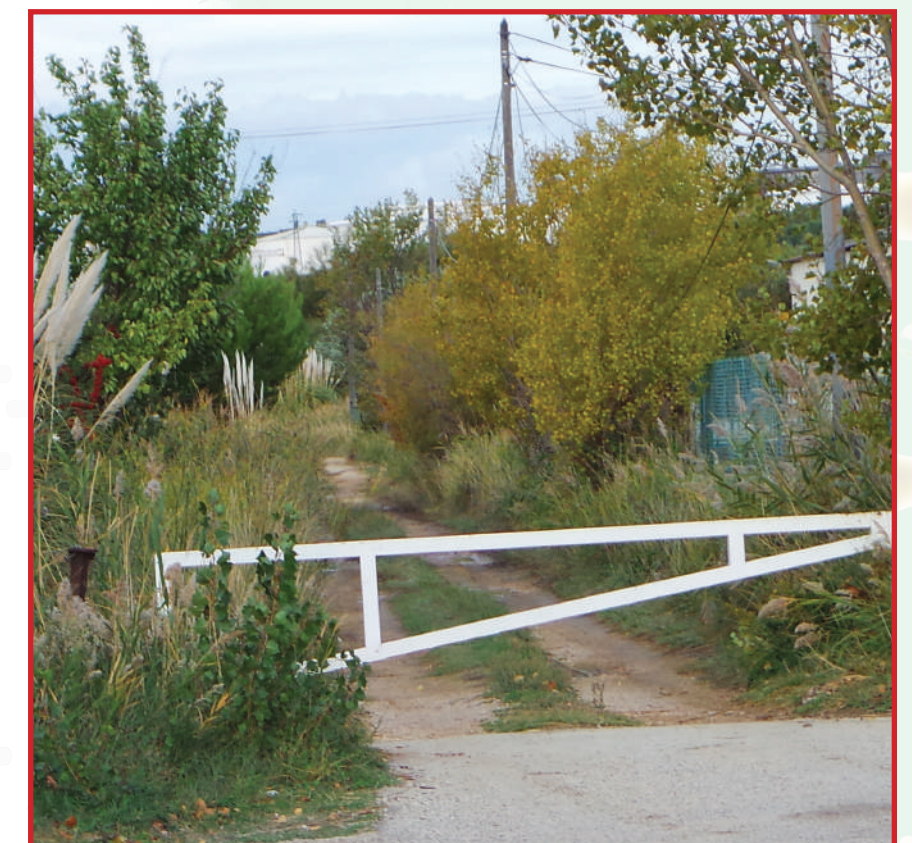
« Une entrée isolée », quel trésor renferme t-elle ?

Après la traversée du cours d'eau, nous arrivons jusqu'à une mare, contraste incroyable, reflétant la fumée noire de l'industrie dans ce poumon vert isolé de tout. Tels des Robinsons, nous explorons et traversons ce mur de végétaux qu'est la roselière et qui nous sépare de l'étang. Après ce périple, l'étang se tient devant nous, isolés, sommes-nous seuls au monde ?