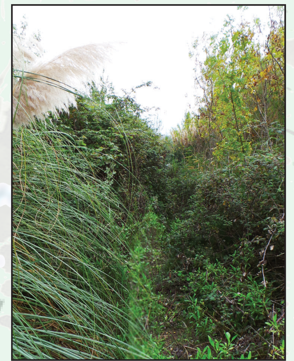
Les Passadouïres; coulée verte réservée aux aventuriers.