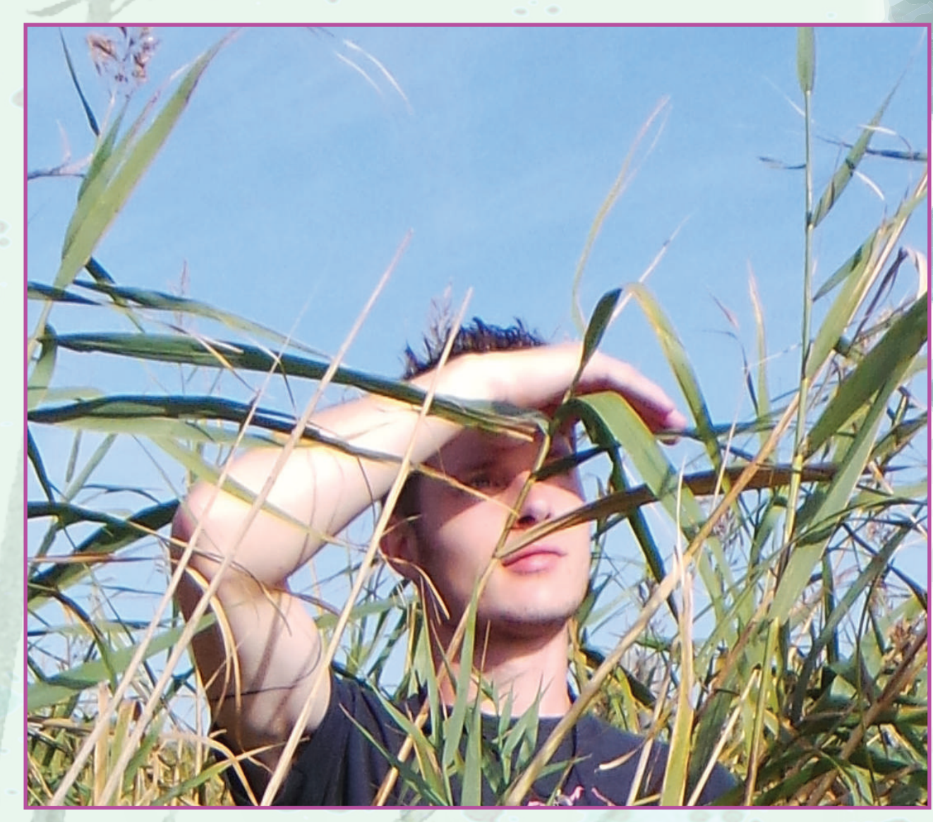
Comme Robinson... Sans la barbe.