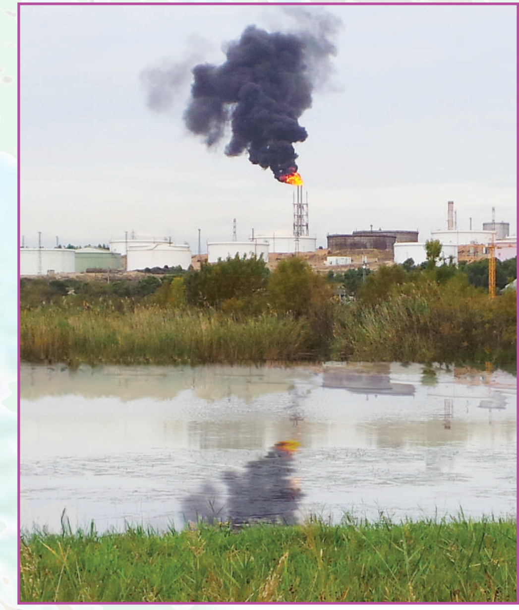
Isolé de tous, cet Eden avoisine les usines.

Ancien passage historique permettant le transport du sel de Berre à Rognac (passadouïres = passerelles), ce chemin est aujourd'hui presque inaccessible. Nous le traversons aidés de machettes, tranchant les ronciers qui nous bloquent l'avancée. A travers la forêt, le chemin des passadouïres se dessine, au même titre que les parties les plus au coeur du marais.