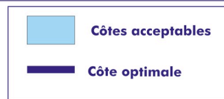
Schéma simplifié des objectifs de gestion des niveaux d'eau (ouvrage Canal de la Matte)