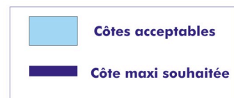
Schéma simplifié des objectifs de gestion des niveaux d'eau

Remarque : Il n'existe pas d'ouvrage permettant le contrôle du niveau d'eau dans la lagune de l'étang de Pissevaches. Les échanges avec la mer se font de manière naturelle, en fonction du niveau de l'étang, de celui de la mer et de la direction et de la force du vent. L'eau peut ainsi circuler alternativement de l'étang vers la mer ou de la mer vers l'étang. Quand la cote de la lagune atteint une cote élevée et que le vent est favorable, le cordon de sable séparant l'étang de la mer (grau) peut se rompre naturellement et conduire à une vidange rapide de la lagune